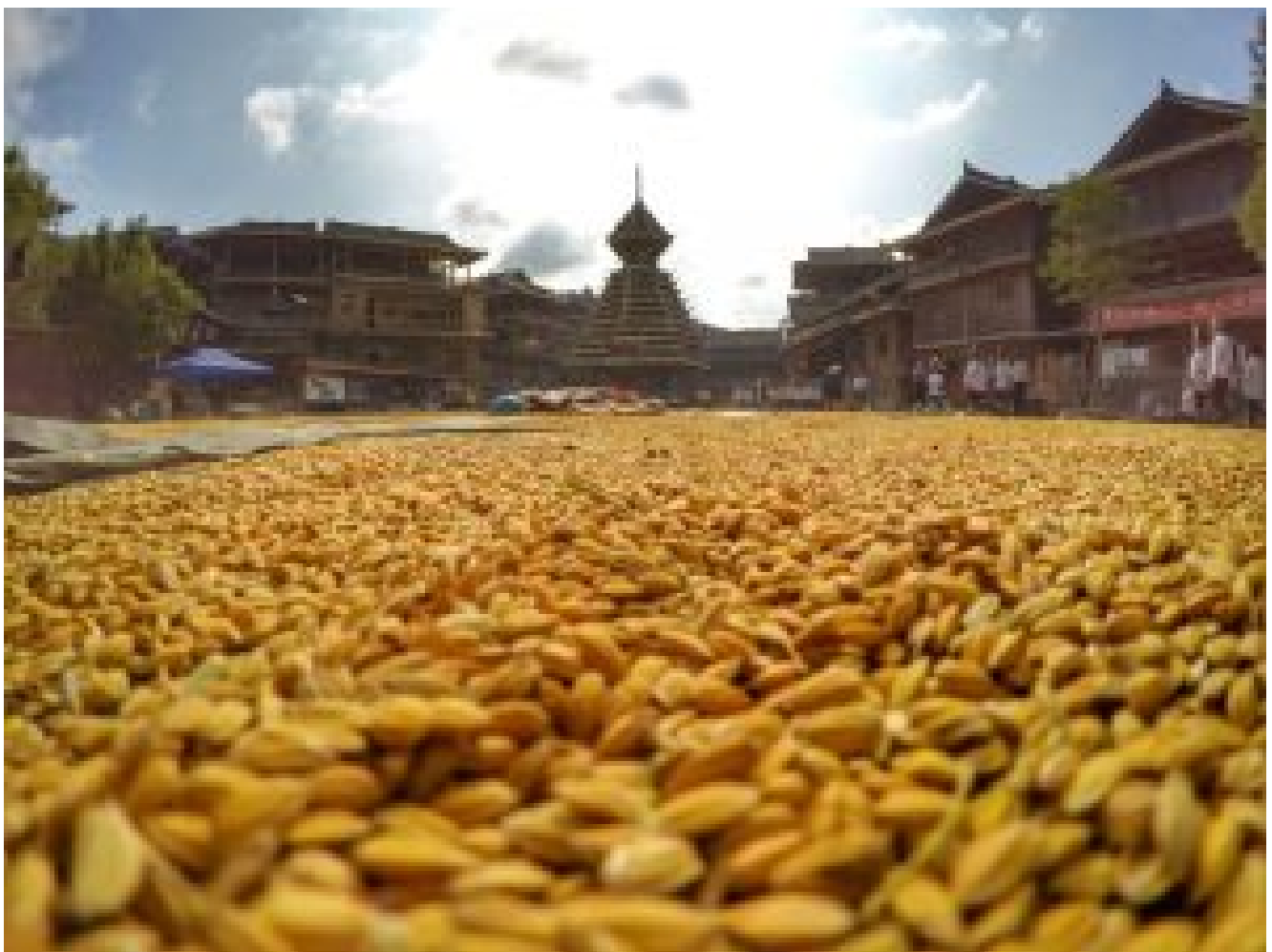
A good harvest...

Durante más de 2.500 años, los dong han practicado y transmitido su tradición mediante el canto. Un proverbio del pueblo dong dice que “el arroz alimenta el cuerpo y las canciones el alma” 1 , lo que representa el valor indispensable de cantar en su vida diaria. En tu viaje a Kaili de este agosto, aprovecha para explorar el paisaje único del centro de la China meridional, sus excepcionales vistas y su tradición multicultural.