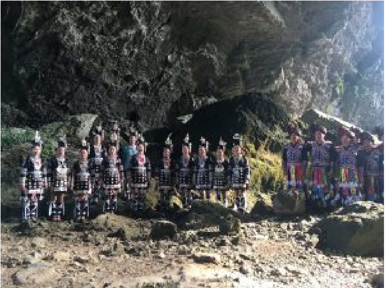
Dong Singers (picture taken in 2016)

servirse del Feng Shui y proteger la fortuna de la aldea.