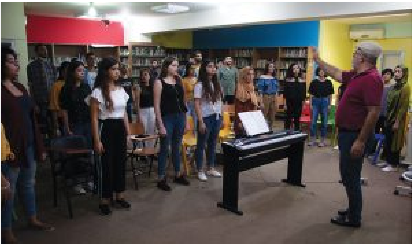
Nagham Choir, Lebanon

Alles begann nach dem Libanon-Konflikt 2007 zwischen Fatah al-Islam, einer militanten islamistischen Organisation, und den libanesischen Streitkräften in Nahr El Bared, einem Camp der UNRWA für palästinensische Flüchtlinge in der Nähe von Tripoli im Nordlibanon, als die UNDP an den Fayha-Chor herantrat und diesem das Projekt eines „Lebanese Palestinian Choir“, also eines libanesisch-palästinensischen Chors vorschlug. Dieses Projekt hatte zum Ziel, die friedlichen Beziehungen zwischen den Palästinensern, die in das Camp nach dessen Wiederaufbau zurückkehrten, und der libanesischen Community in fünf um das Camp angesiedelten Dörfern wiederherzustellen.