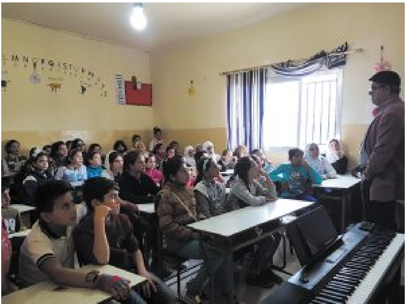
Children of Syria

Nach Reisen durch die ganze Welt und zahlreichen internationalen Auszeichnungen ist der Fayha-Chor für das libanesische Volk das Aushängeschild des Landes geworden, da er die ganze Bevölkerung repräsentiert und das wahre zivilisierte Gesicht der Libanesen und Araber zeigt. Das ist besonders wertvoll, weil die schlechten Nachrichten aus der Region mehr Raum in den Medien zu erhalten scheinen.