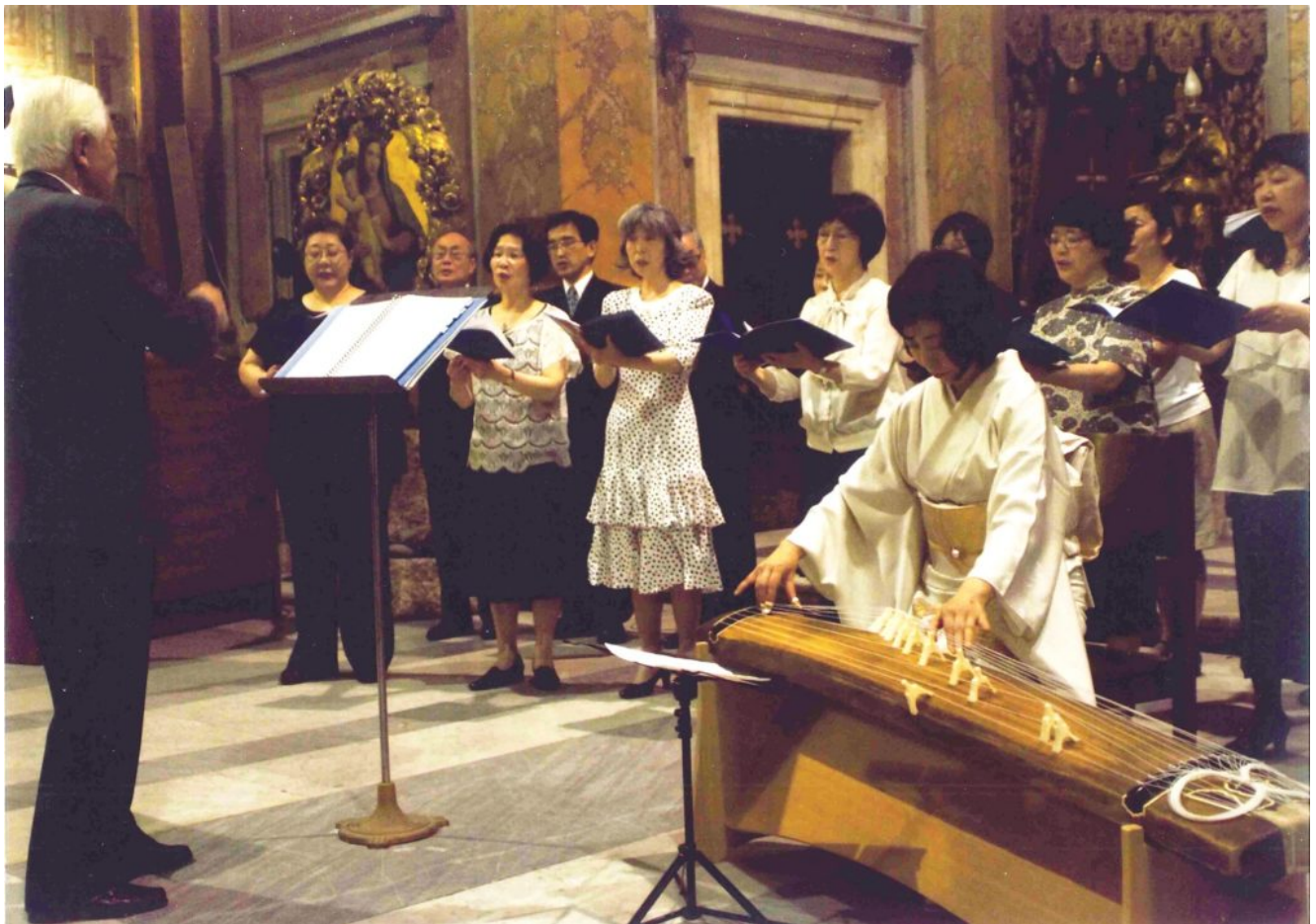
Synchronized performance of Rokudan and the Latin Credo on July 2012, in Rome

Nach weiteren detaillierten Untersuchungen wurde es jedoch unabdingbar, viele meiner in früheren Studien durchleuchteten Streitpunkte zu überdenken. Dies betraf vor allem die Verbindung zwischen dem Rokudan , geschrieben für das koto -Instrument, und dem lateinischen Credo .