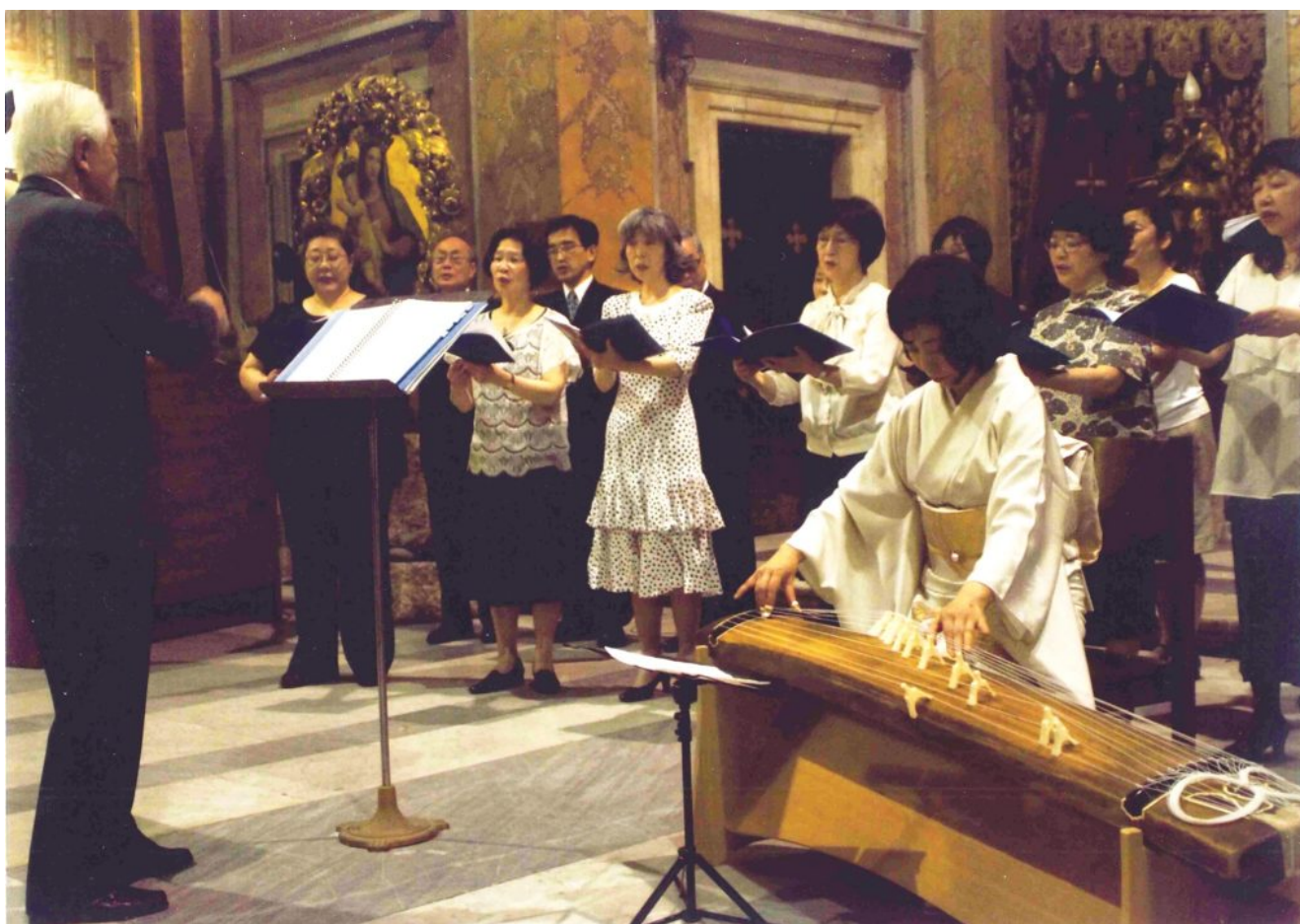
Synchronized performance of Rokudan and the Latin Credo on July 2012, in Rome

Nach weiteren detaillierten Untersuchungen wurde es jedoch unabdingbar, viele meiner in früheren Studien durchleuchteten Streitpunkte zu überdenken. Dies betraf vor allem die Verbindung zwischen dem Rokudan , geschrieben für das koto -Instrument, und dem lateinischen Credo .