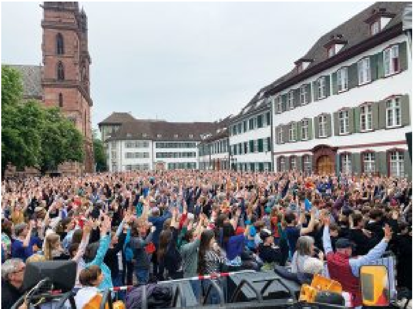
Body Percussion © Ueli Renggli

Übersetzt aus dem Englischen von Silke Klemm, Belgien