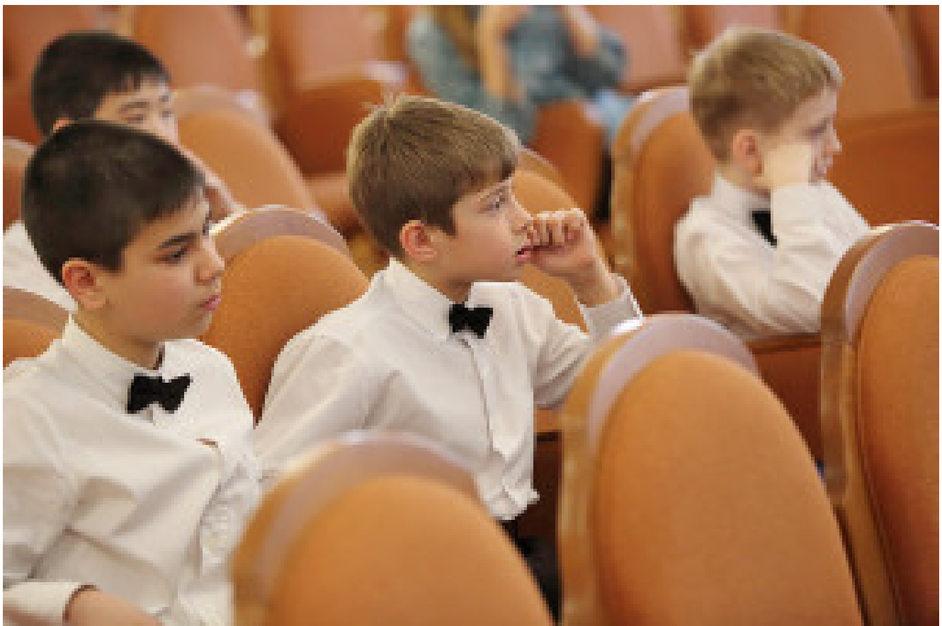
Choir 'Vdohnovenie' (Inspiration) from Kamensk-Ural'skiy

Die Stadt pflegt sorgfältig ihre mehr als 50 Museen. Die wundervoll reichhaltigen Sammlungen des Kraevedcheskii-Museums führen Sie in die Geheimnisse der Geschichte des Urals und des Uralgebirges ein. Im Museum zur Geschichte der Stadt Jekaterinburg haben die Besucher Gelegenheit, individuell und ohne Hast die Geschichte der Stadt zu entdecken.