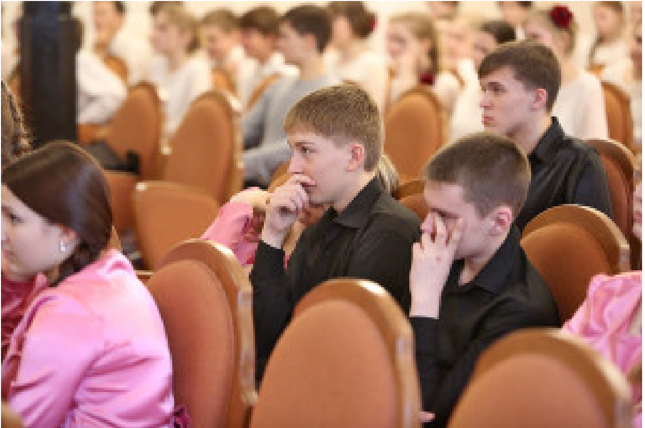
Choir 'Flamingo' from Nizhniy Tagil

Jekaterinburg ist eines der großen Theaterzentren Russlands. Es gibt 24 Theater in der Stadt, von denen die meisten nicht nur in Russland, sondern auch im Ausland bekannt sind. Die vielen Preise, die unsere Theater beim Festival "Goldene Maske", Russlands wichtigstem Theaterfestival, gewonnen haben, zeugen von der Originalität ihrer Vorstellungen. Das städtische Puppentheater in Jekaterinburg ist der Veranstaltungsort für den "Großen Petruschka", das berühmteste Festival für Puppentheater weltweit. Auch das internationale Clown-Festival hat mehrere Jahre in Jekaterinburg stattgefunden und ist einzigartig in der weltweiten Zirkus-Geschichte.