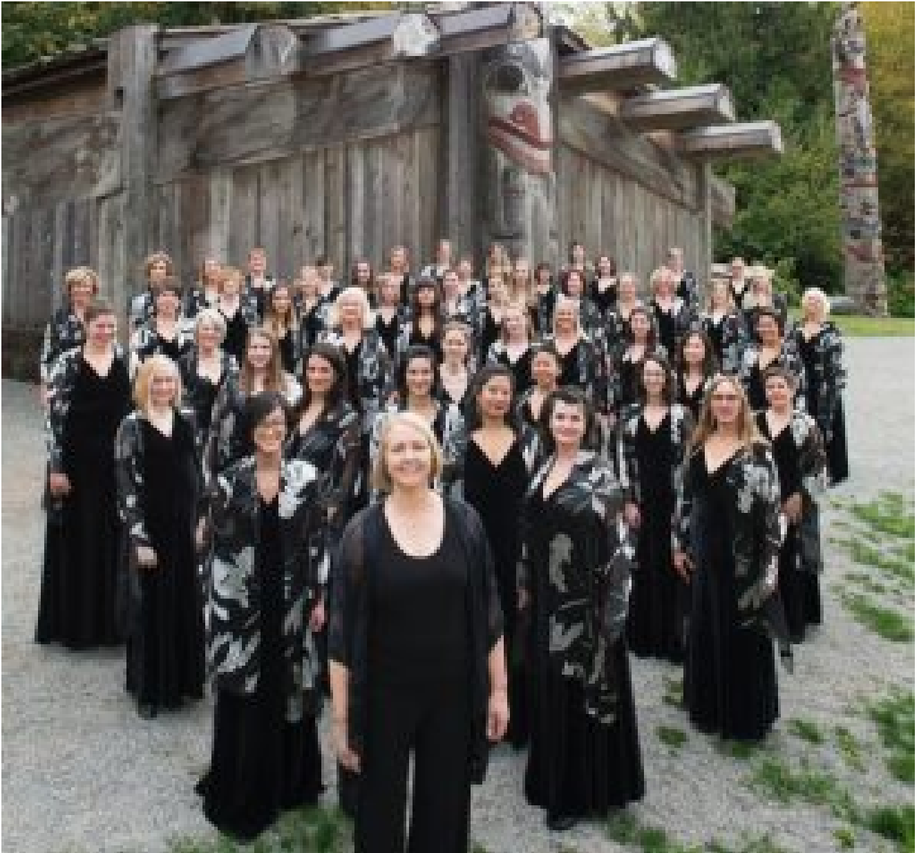
Elektra Women's Choir