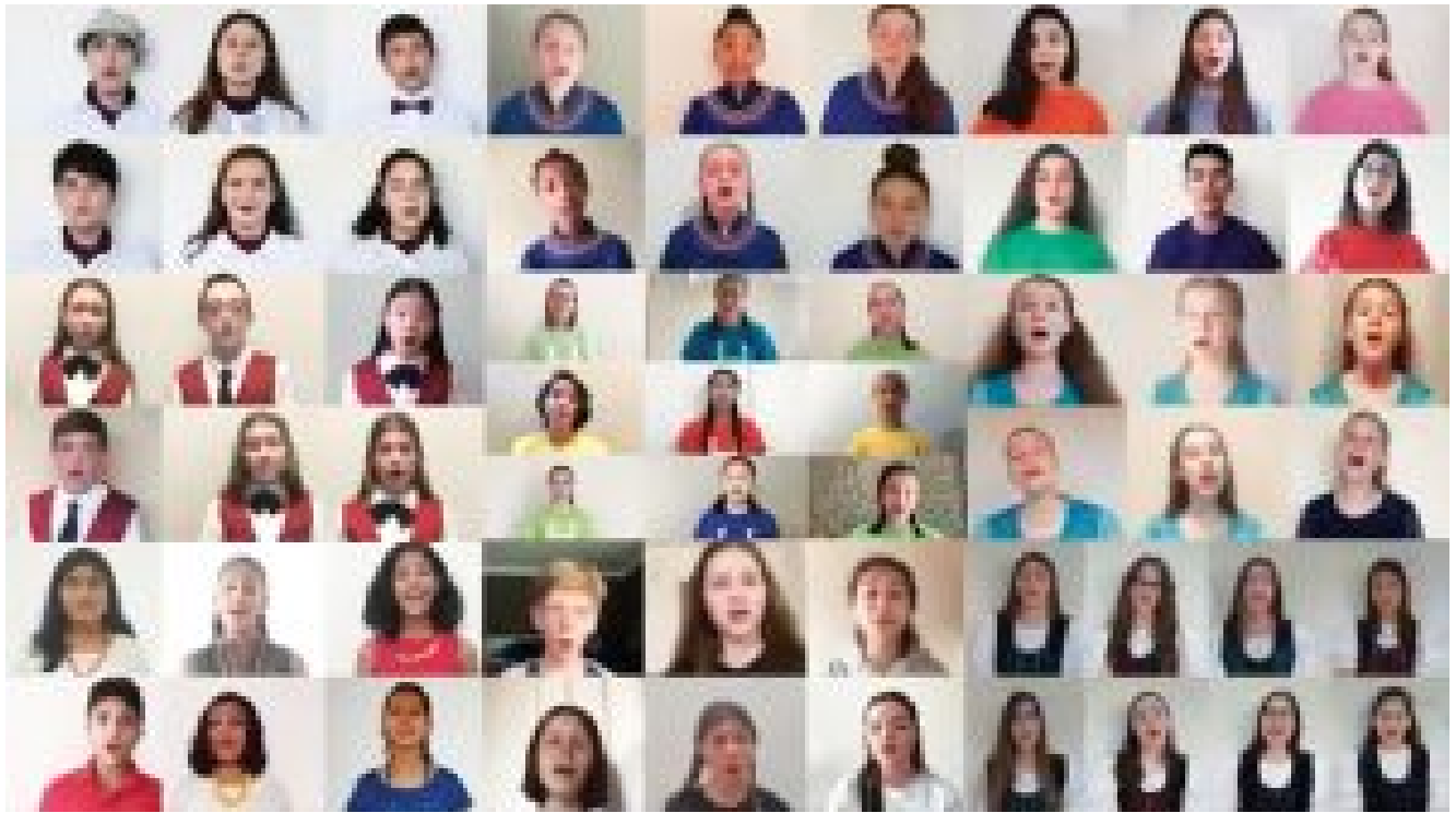
Young Voices of the World participants: 1st and 2nd rows (from left to right) Kodaly Conservatory Children's Choir of Greece, Tygerberg Children's Choir, Leioa Kantika Korala Children's Choir; 3rd and 4th rows (from left to right) Shenandoah Valley Children's Choir, Hamilton Children's Choir, Ponomaryov Vesna Children's Choir; 5th and 6th rows (from left to right) Soul Sounds Academy, Kinderchor der Staatsoper Unter den Linden, Cantemus Children's Choir