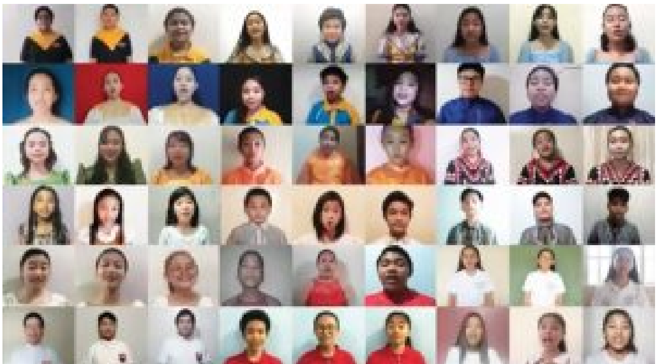
Young Voices of the World participants: 1st row (from left to