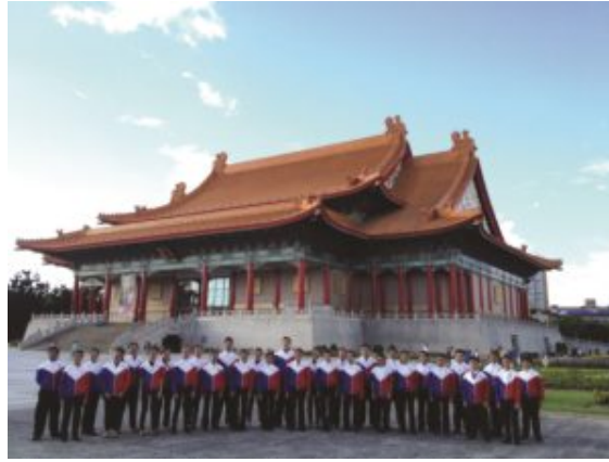
National Concert Hall in Taipei, Taiwan