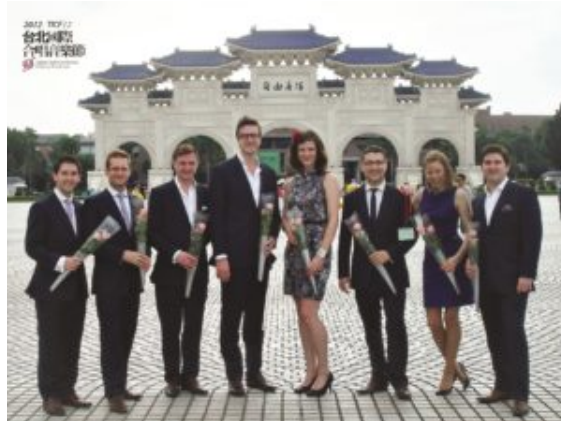
VOCES8 on Freedom Square, Taipei, Taiwan