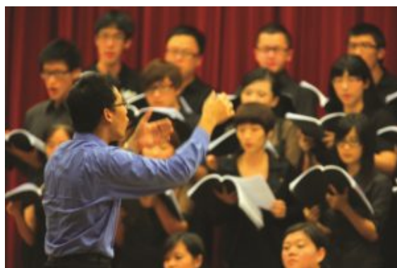
A conducting master class participant rehearsing with