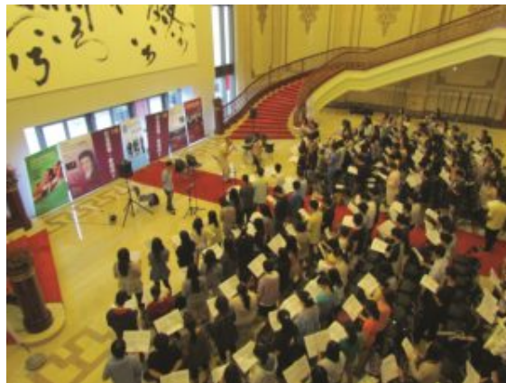
PUST (Norway) giving a workshop to the festival participants and singers