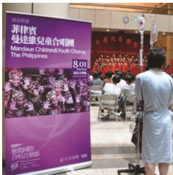
Mandaue Children & Youth Chorus (The Philippines) performing in the Taiwan University Hospital

Junto con los conciertos gratuitos celebrados por las tardes en diversos lugares públicos de Taipei, el TICF de 2012 presentó un total de 25 conciertos a los que acudieron decenas de miles de espectadores.