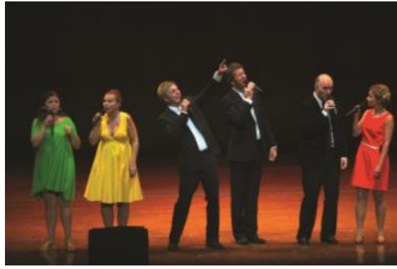
PUST in concert

El TICSF de 2012, además de los conciertos de apertura, presentó en los ciclos de conciertos del festival a 6 coros excepcionales: Eva Quartet (Bulgaria), Children and Young Women's Chorus of the China National Symphony (China), Kammerchor Stuttgart (Alemania), PUST (Noruega), Mandaue Children & Youth Chorus (Filipinas) y VOCES8 (Reino Unido). Cada tarde-noche, entre el 28 de julio y el 5 de agosto, los conciertos de dichos grupos acogieron a miles de espectadores que disfrutaron de sus fascinantes repertorios, sus excelentes habilidades vocales y la fabulosa atmósfera multicultural, tanto en el National Concert Hall de Taipei como en los escenarios de otras ciudades de Taiwán.