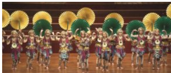
Mandaue Children & Youth Chorus (The Philippines) performing in the National Concert Hall

El TICSF de 2012, además de los conciertos de apertura, presentó en los ciclos de conciertos del festival a 6 coros excepcionales: Eva Quartet (Bulgaria), Children and Young Women's Chorus of the China National Symphony (China), Kammerchor Stuttgart (Alemania), PUST (Noruega), Mandaue Children & Youth Chorus (Filipinas) y VOCES8 (Reino Unido). Cada tarde-noche, entre el 28 de julio y el 5 de agosto, los conciertos de dichos grupos acogieron a miles de espectadores que disfrutaron de sus fascinantes repertorios, sus excelentes habilidades vocales y la fabulosa atmósfera multicultural, tanto en el National Concert Hall de Taipei como en los escenarios de otras ciudades de Taiwán.