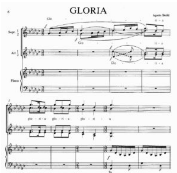
Imagen 2. Sköld, Gloria , Walton Music HL08500321

(Click on the image to download the full score)