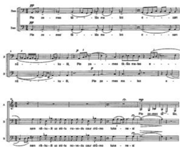
Imagen 3. Einfelds, Pie zemes tālās (en el borde del mundo)

(Click on the image to download the full score)