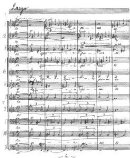
Imagen 4. Einfeldes, Lux aeterna (partitura)

(Click on the image to download the full score)