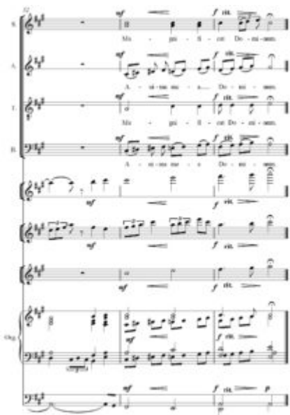
Imagen 1. Vasiliauskaitė, Magnificat , movimiento 1, Información sobre la Música Litwana: www.mic.lt

(Click on the image to download the full score)