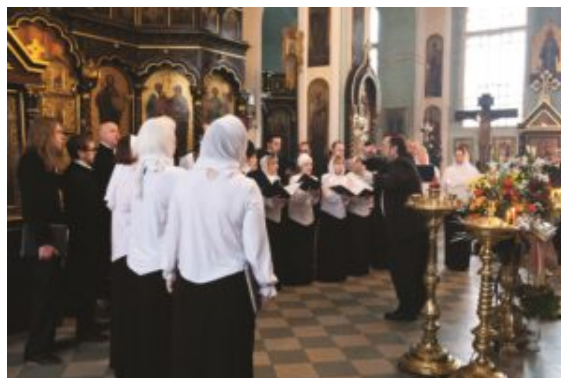
Ivanovo Chamber Choir,