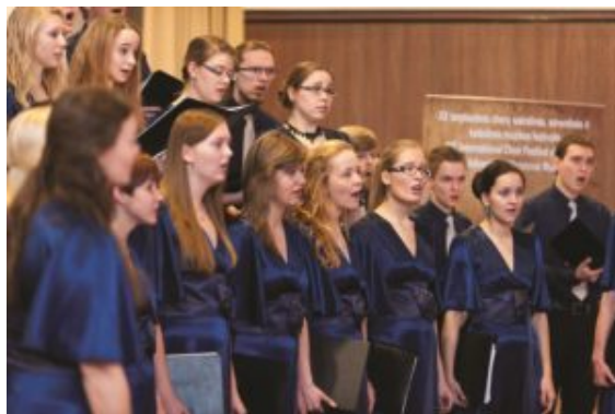
Tartu Youth Choir, Tartu, Estonia

propia, cubierto con tantas capas de ropa que parecía que iba a emprender una expedición al polo norte. Por cierto, fue fantástico pasar el tiempo entre grog y café caliente. El primer día del festival finalizó con un concierto muy bonito en el que actuaron algunos de los coros participantes y en el que el coro infantil Varpelis (Lituania) interpretó el Oratorio de Navidad de J.S. Bach.