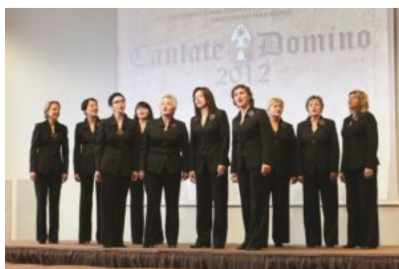
Vocal Ensemble Cantilena, Ukmerge, Lithuania