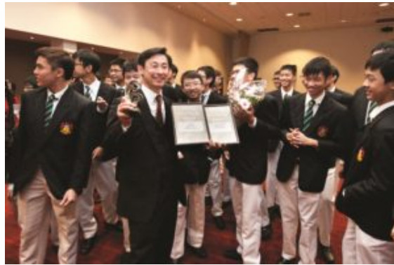
Raffles Voices, Singapore. awarded

mixto A Capella (Lituania), dirigido por Violeta Zutkuvienė y, de nuevo, al Tartu Youth Choir. Estos cuatro coros jugaron todas sus cartas en la fase final, celebrada el último día en el Seminary Auditorium. The Raffle Voices resultó ser el ganador del Grand Prix, con una puntuación de 97.5/100.