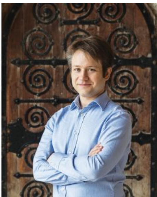
Mihály Zeke

sensibilidad notables en cada grabación. La fuerza de su acompañamiento sólo encuentra combinación con su delicadeza técnica en perfecta colaboración con los cantantes.