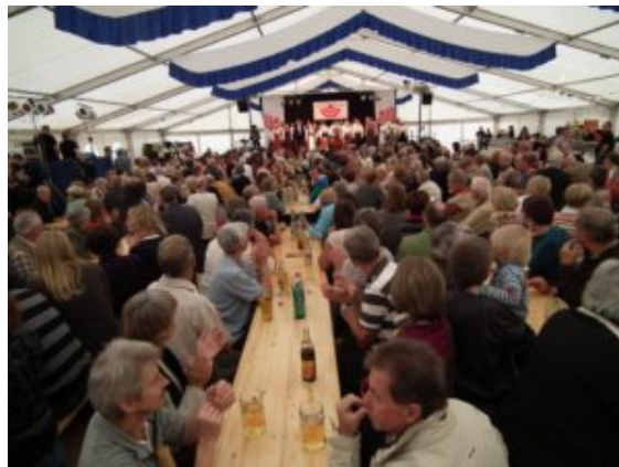
Female Choir of Estonian Choral Conductors in the beer tent on Whit Monday

Hubo dos categorías en el concurso 2011: A) Coros mixtos y B) Coros femeninos. Estos fueron, en orden de aparición en la primera ronda: Coro de Cámara de la Academia de Jerusalén (Israel); Cantabile (Regensburg, Alemania); Coro Entrevoces (La Habana, Cuba); Cardinal Singers de la Universidad de Louisville (Estados Unidos); Molto cantabile (Lucerna, Suiza);