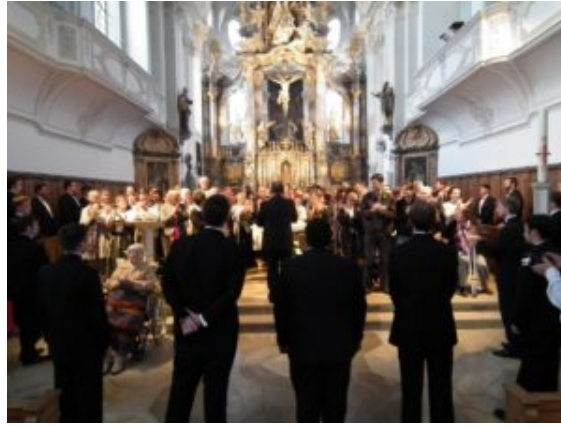
University of Louisville Cardinal Singers performing in surround sound in the Church of St. Martin Marktobersdorf

La gente salió en masa hacia el foyer, rechazando el azúcar en su café. Cínicos comentarios generaron nuevas camaraderías y reavivaron antiguas disputas. La discusión estuvo menos centrada en el repertorio y el estilo, y más en la presentación y el deseo de escuchar la historia que se contaba dentro de cada obra. ¿Este método era un acto sincero o de abandono?