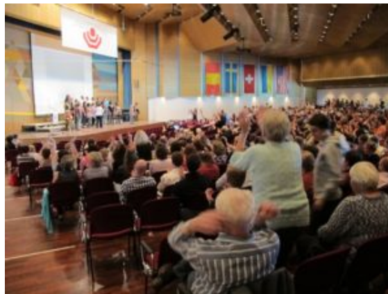
An appreciative audience in the MODEON