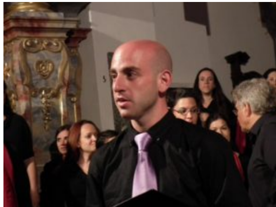
In rehearsal mood – a member of Jerusalem Academy Chamber Choir

En el desarrollo del concurso, la cesura era un paso obligatorio en los programas libres de la segunda ronda. Predominaron el temperamento y el timbre, pero no suprimieron el mayor activo de cada grupo. Fuimos testigos entonces del sonido granular del Coro de Cámara de la Academia de Jerusalén dirigido por Stanley Sperber, de la regularidad lineal de la