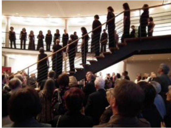
VokalArs Madrid singing for sponsors in the foyer of the Bavarian Music Academy Marktoberdorf

Las exigencias eran realmente altas. Cada coro sonaba como ganador. Y tomé la obra obligatoria, Rhapsodia , de Joseph Gabriel Rheinberger, para ayudar a que el público y el jurado formaran igualmente opiniones más diferenciadas. Pero al final del largo día, otros factores comenzaron a desempeñar un rol: por ejemplo, qué obras funcionaban mejor en la acústica ligeramente implacable del MODEON.