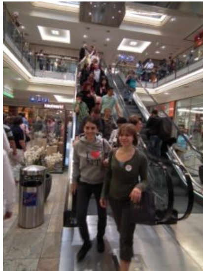
Flash mob in the local supermarket