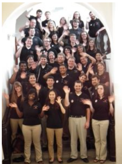
University of Louisville Cardinal Singers on a day trip to the Lautrach Castle

Coral de la Universidad del Oriente (Manila, Filipinas); Kammerchor der Hochschule für Musik Detmold (Alemania); St. Jacobs Ungdomskör (Estocolmo, Suecia), en los coros de voces mixtas; y los coros femeninos VokalArs, de Madrid, España (con un tenor para empezar); el Coro Femenino de Kiev del Instituto de Música Glier (Ucrania); Kamerkoor Cantate Venlo (Holanda); y el Coro Femenino de Directoras Corales Estonias (Tallinn, Estonia).