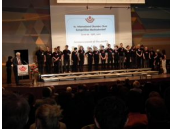
Introducing competition staff during the prize giving ceremony in the MODEON Marktoberdorf