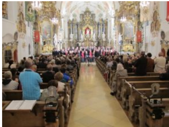
A joint performance by S:t Jacobs Ungdomskör and Cantabile Regensburg in the Church of St. Ulrich Seeg