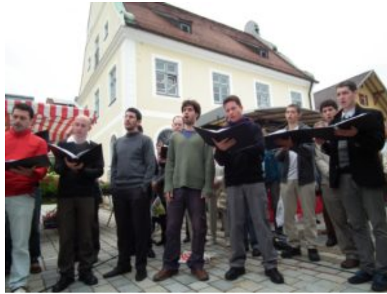
Jerusalem Academy Chamber Choir singing on the market square Marktoberdorf