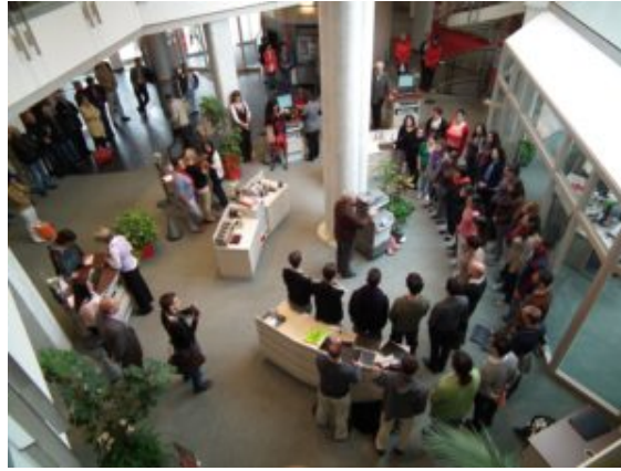
Jerusalem Academy Chamber Choir performing in the local bank – the Sparkasse Marktoberdorf

El Concurso de Coros de Cámara de Marktoberdorf data de hace unos veinte años, y ha madurado tardíamente, pues desde sus modestos inicios se ha ido cubriendo de un manto de profesionalismo. Apenas ha tenido un lugar de conciertos, una grabación que se puede adquirir como un CD o DVD en la empresa audiovisual del propio festival, Audio•Video•Aktuell GbR. El foyer del MODEON se convierte en un área de visualización pública durante los conciertos, donde los coros que esperan para competir pueden mirar las actuaciones y los recién llegados se pierden poco. Las cámaras a control remoto en el hall de la sala, innecesariamente, retrasan un poco los programas.