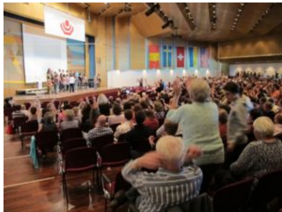
An appreciative audience in the MODEON