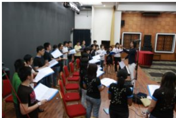
Choir clinic with choral expertise

Este país multicultural tiene realmente una potencialidad enorme en el desarrollo de la música, en particular de los coros, ya que Indonesia cuenta con numerosos y valiosos recursos humanos. Sin embargo, la limitada expertise en educación musical y la falta de apoyo por parte del gobierno pueden conducir a un desarrollo desigual de la música coral en Indonesia, y provocar brechas en cuanto a la evolución entre una y otra región del país.