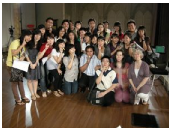
Workshop on vocal using kazoo with an international vocal coach from London

muchos militantes indonesios de música coral ávidos de nuevos conocimientos. El proceso de la transferencia de conocimiento tiende a producirse en instituciones musicales privadas, más que en la escuela pública. Mientras los coros escolares públicos ven restringido su desarrollo debido a la limitada educación musical de los profesores, las escuelas de música privadas avanzan de manera notable en este campo, ya que los docentes tienen formación académica internacional y más experiencia en enseñar a coros.