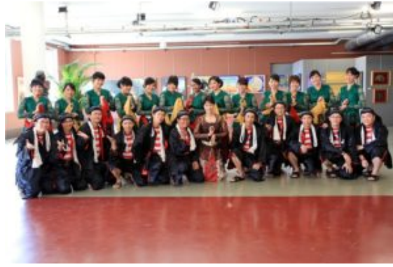
Wearing traditional costume for singing the Javanese traditional song

Indonesia es una tierra festiva, donde la gente organiza festivales y celebra la vida de vez en cuando. El canto y la danza están presentes en todas las festividades, y también en las bienvenidas a visitantes en las aldeas. El canto grupal ha sido parte de las costumbres, y tradicionalmente han existido coros en Indonesia, aunque en un estilo de canto al unísono. La música y el ritmo son partes de la actividad de la población, mientras plantan y cosechan el té, durante la pesca y el cultivo del arroz, durante las plegarias en el templo en la cima de las montañas, y en el juego de los niños en el patio de una pequeña choza.