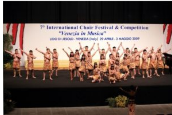
O rcaellae Vox Sacra choir singing Yamko Rambe

canción; y, en todo caso, embellece la obra en su interpretación global.