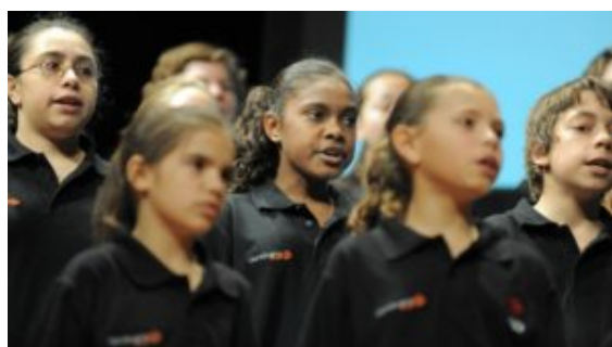
Gondwana National Indegenous Children's Choir at Sydney Opera House Open Day

De estos Campamentos Regionales de Música, los niños son seleccionados para que formen parte del Coro Infantil Aborigen Nacional de Gondwana, que se reúne a nivel nacional para trabajar en proyectos y actividades específicos. Desde la creación del coro, los niños del GNICC han tenido la oportunidad de viajar y cantar en la Ópera de Sidney y en una importante campaña publicitaria televisiva en la Shanghai World Expo en China y en Estados Unidos.