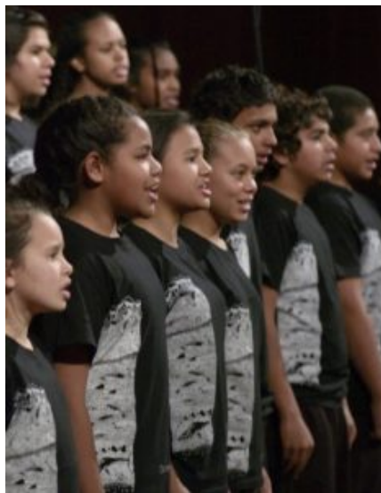
Gondwana National Indigenous Children's Choir

para luego presentarse en conciertos y realizar giras nacionales e internacionales a lo largo del año. Con interpretaciones de elevado nivel, los numerosos coros Gondwana colaboran a menudo con nuestros mejores compositores y agrupaciones instrumentales, tales como la Sinfonía de Sidney, Ensamble de Percusión Sinergia y la Orquesta de Cámara Australiana. El Coro Infantil Aborigen Nacional de Gondwana es la agrupación más reciente de nuestra familia coral.