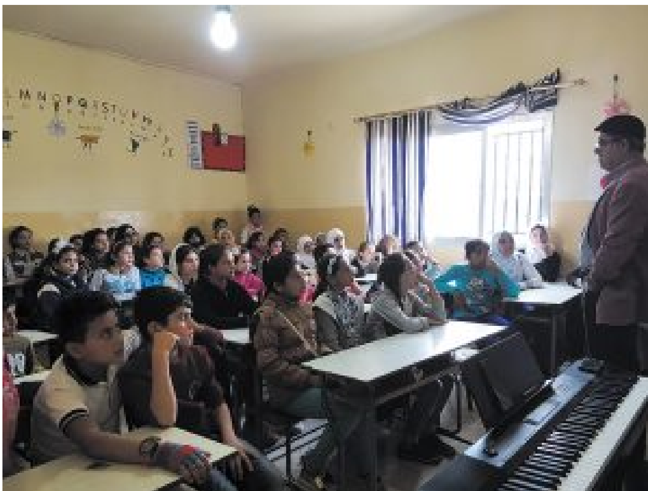
Children of Syria

Después de recorrer el mundo y de ganar premios internacionales, Fayha Choir se convirtió en la mejor imagen nacional para los libaneses, por representar a toda la población y mostrar el verdadero civismo de los libaneses y árabes. Esto cobra especial relevancia partiendo de que los medios de comunicaciones internacionales difunden sólo noticias negativas sobre esta región.