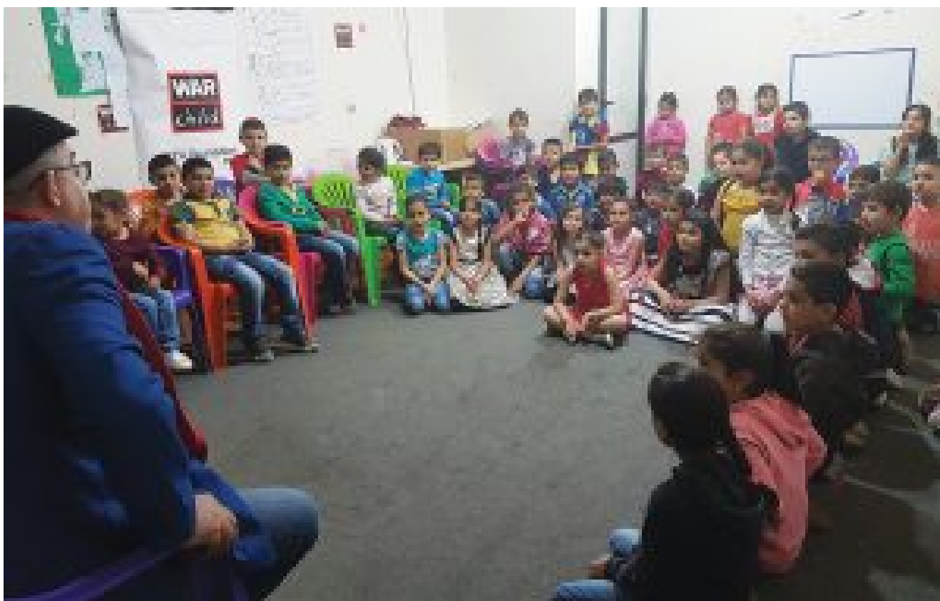
War Child Choir

Fayha Choir tiene algunos proyectos parecidos que puedes ver en su página web, además de colaborar en proyectos de cooperación internacional para refugiados como "Sing Me In". También podrás encontrar documentales sobre los proyectos en nuestro canal de Youtube.