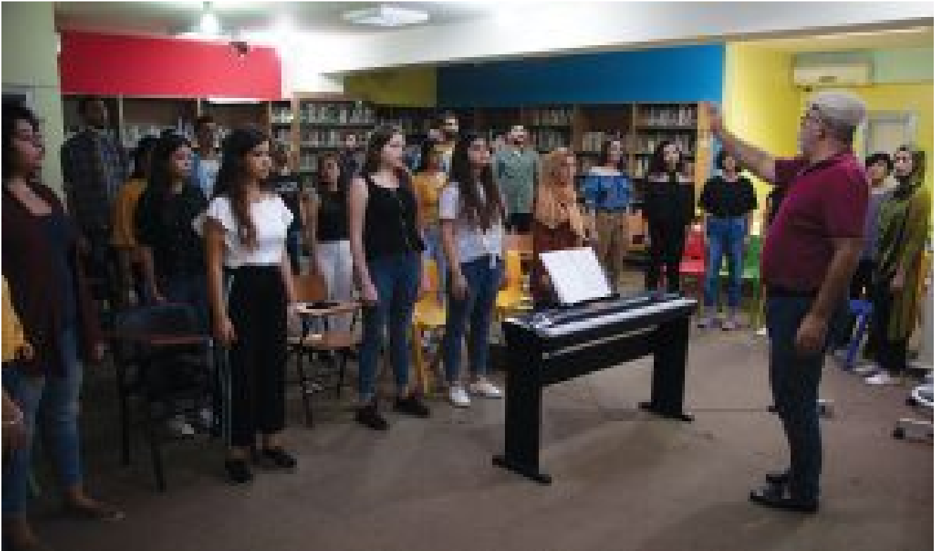
Nagham Choir, Lebanon