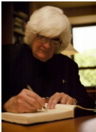
Marlos Nobre, Brazil.

libro de Lautréamont, en el Teatro Colón de Buenos Aires. Editó, como solista, cerca de 40 discos. "Árboles" ganó en 2008 el premio Gardel (Argentina) al "mejor álbum instrumental". L.M. publicó también cerca de 40 libros, entre los que se cuentan novelas, recopilaciones de cuentos y obras de teatro. Su obra "Telecomedia" fue distinguida con el premio nacional de literatura del Uruguay en el año 2000.