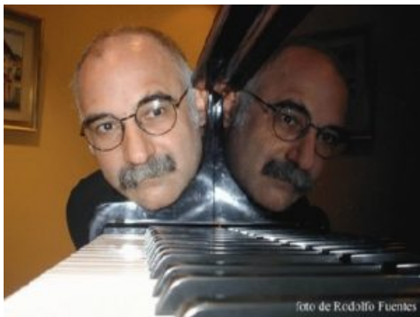
Leo Masliah, Uruguay.

UNBA (1958). En 1977 obtuvo la Beca Guggenheim y los premios Nacional y Municipal en composición durante los años '90. Distinguido con el "Magistere" por su trabajo pionero en Música Electroacústica por el Instituto Internacional de Música Electroacústica de Bourges (IMEB). Principal investigador en el programa de intercambio con las Universidades de Stanford, California y San Diego, de Estados Unidos, relacionado con la composición de música por computadora. Ha dictado cursos y conferencias en composición y análisis musical en numerosos países europeos y americanos durante los últimos 40 años. Su música instrumental y electroacústica ha sido ejecutada en todo el mundo. Sus artículos e investigaciones sobre diferentes aspectos musicales han aparecido in varias publicaciones especializadas.