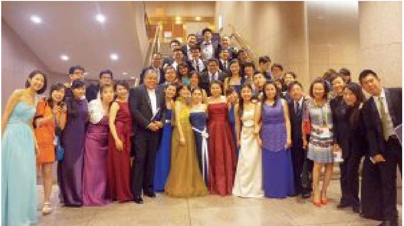
Asia Pacific Youth Choir, WSCM 2014, Seoul, Rep. Korea

Cuando se le pidió a Ko Matsushita que escribiera sobre “Cómo formar a los directores corales en Asia”, sintió que el ámbito asiático es tan amplio y que incluye a tantos países que es imposible hablar de un “estilo asiático”. Es por esto que ofreció presentar su propio método (ver su artículo aquí). También escribió un breve informe sobre el estado actual de la educación coral en algunos de los países referentes de la música coral en Asia. Aquí lo tienen.