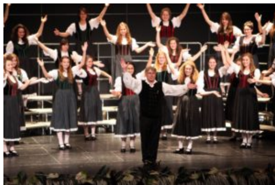
Cantemus Children's Choir Javier

El Cantemus Children's Choir de Nyíregyháza ( Hungría ) es uno de los testimonios del arte coral moderno en Hungría. Cariñosamente educados por su fundador Dénes Szabó, este coro ha ganado un increíble número de premios en competiciones internacionales a través de toda Europa, así como también el "Foundation for Hungarian Arts Prize" en 1989, y el "Bartók Bela – Pasztory Ditta Prize" en 1993. La evidente calidad musical de este coro, así como su trabajo pedagógico de alto perfil, lo han convertido en una escuela excepcional, la cual ha preparado a muchos músicos para sus carreras profesionales. Estas cualidades se han demostrado en los varios escenarios internacionales donde el Cantemus Children's Choir ha triunfado. El coro formó parte del GPE luego de ganar el "Tolosa Grand Prix" en 2010, y cantó obras de Cristóbal Morales, Tomás Luis da Victoria, Giovanni Pierluigi da Palestrina, Felix Mendelssohn-Bartholdy, y maestros contemporáneos como Kodály, Orbán, Szymko y el genio de la música vasca, Javier Busto. Vale mencionar también a la performance de Confitemini Domino , una obra nueva del joven compositor Húngaro, Levente Gyöngyösi, quien jamás deja de sorprendernos con sus creativas ideas musicales.