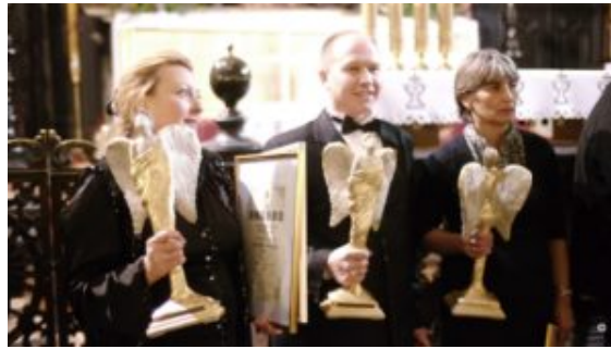
Krakov Advent & Christmas Choir Festival: the awards ceremony in the beautiful Mariacki Church