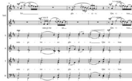
Figura 8, Ešenvalds, O Salutaris, c. 21-25

(Click on the image to download the full score)