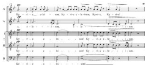
Figura 6, Prauliņš, "Kyrie" de la Missa Rigensis, c. 13-18

La Missa Rigensis entera es una composición fascinante; otros movimientos poseen una equivalente cantidad de misterio, belleza y creatividad. Muchos pueden ser extraídos y presentados como obras independientes, pero la obra está brillantemente concebida y se mantiene como un todo unificado. La Missa Rigensis está disponible en edición de Novello; hay una excelente grabación de la obra ejecutada por Stephen Layton y el Coro de Trinity College de Cambridge en "Intercambio Báltico". Esta grabación producida por Hyperion presenta también el Laudibus in Sanctis de Prauliņš, otra prominente obra coral.