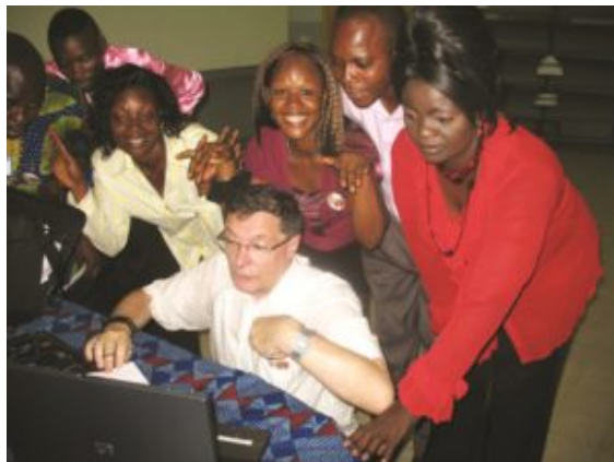
Demonstration of Musica during a conducting workshop in Kinshasa