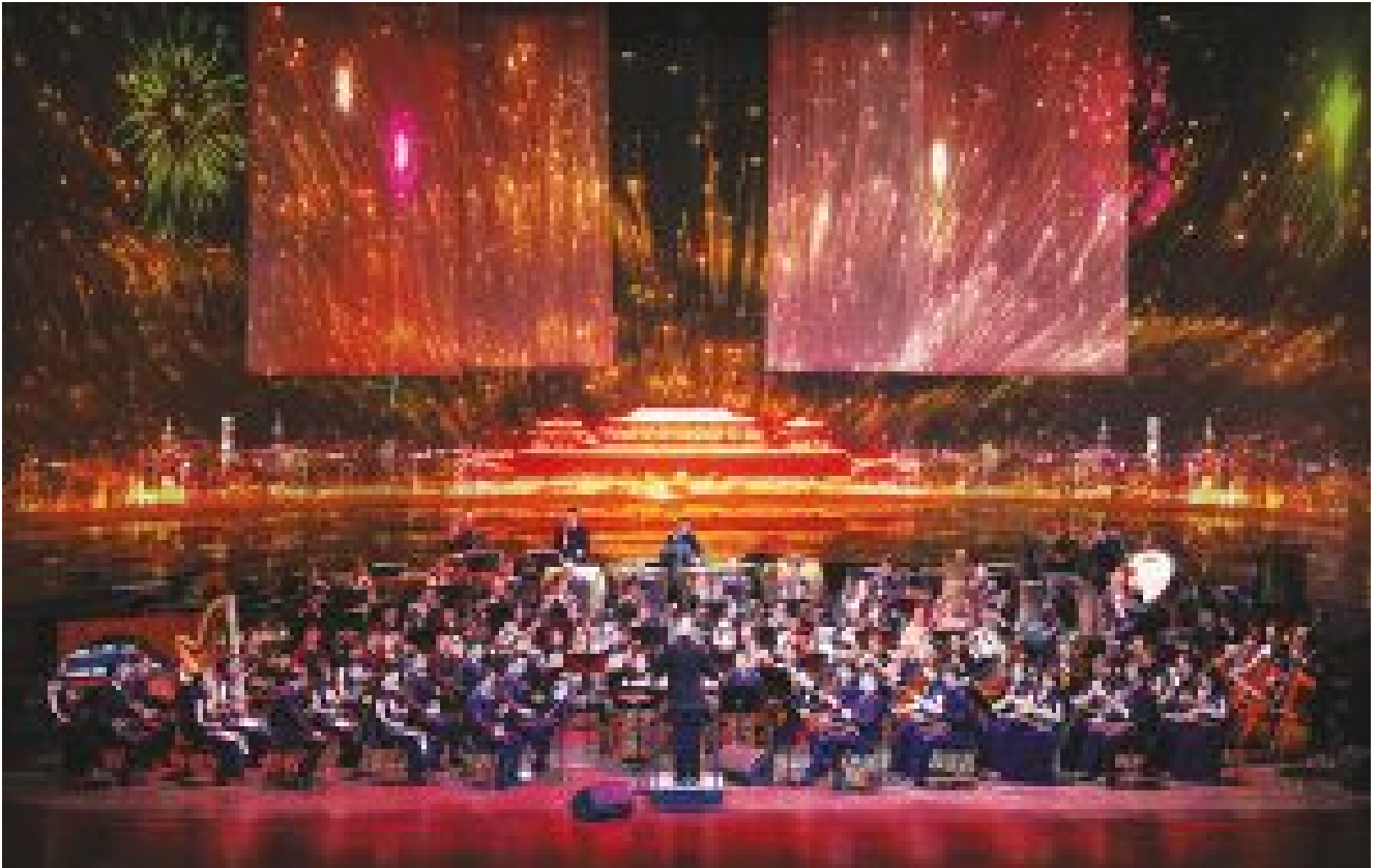
CNTO's themed audiovisual concert Eternal Happiness of Chinese Festival, Beijing Tianqiao Performing Arts Center, Beijing, China, 2020