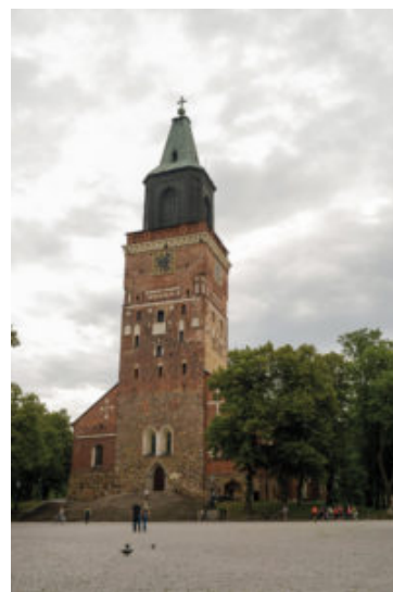
The old Cathedral downtown Turku