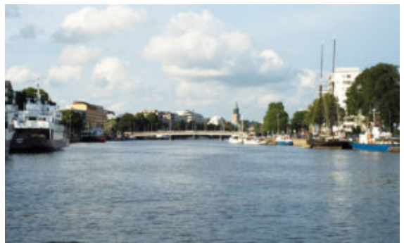
The River Aura, main 'Road' to the market place, the church or the entertainment

a todo tipo de cantor, no importa si cantas en un coro mixto, masculino, femenino o juvenil, ya que habrá actividades para todo tipo de coro. Los talleres están clasificados por colores según el grado de preparación que requieren los cantores: negro (la música es técnica, vocal y/o estilísticamente exigente y requerirá que los cantores se preparen bien), rojo (la música requerirá ciertas exigencias y los cantores tendrán que trabajar en casa antes de acudir al festival) y azul (la música no es muy exigente y un poco de preparación previa permitirá aprovechar el taller sin problema). Como dice el Sr. Turunen: "Nordklang16 no es un evento pensado exclusivamente para cantores expertos. Si tienes experiencia en el canto coral, una voz bonita, ganas de trabajar previamente en la música que se utilizará en el taller y estás dispuesto a trabajar duro, no tendrás problema".