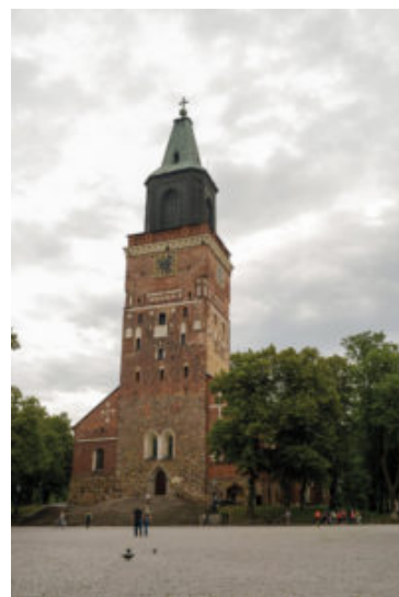
The old Cathedral downtown Turku