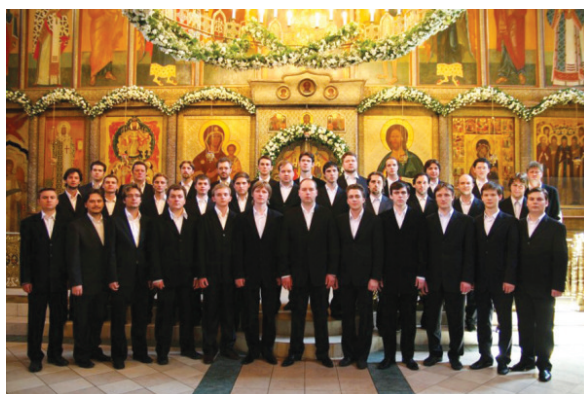
Moscow Sretensky Monastery