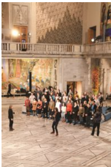
World Youth Choir with Norwegian violinist Gjermund Larsen Olso City Hall

inspiradoras instrucciones de Grete y Gjermund, pudimos brindar un concierto vibrante en el aniversario de la universidad.