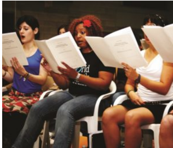
World Youth Choir singers rehearsing