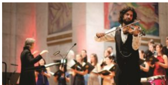
World Youth Choir with Norwegian violinist Gjermund Larsen Olso City