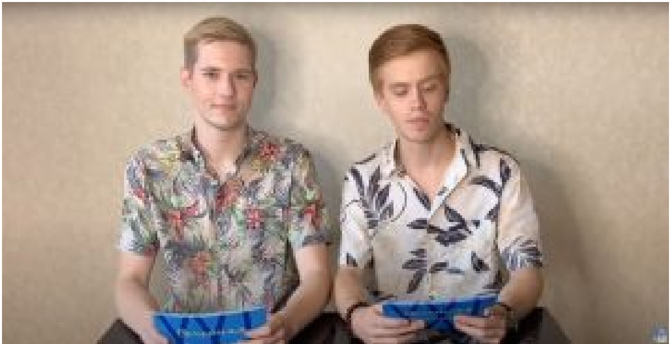
Evening online concerts