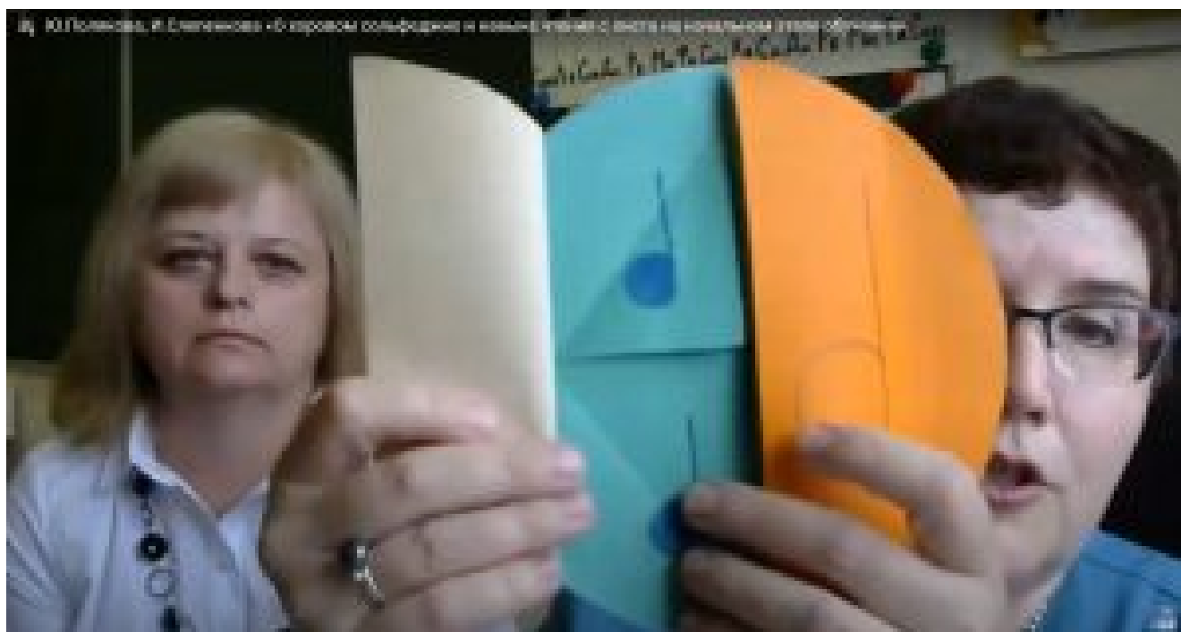
Visual aids for children

A pesar de todos los obstáculos, la Escuela de Verano para directores de orquesta y compositores 2020 fue todo un éxito y objeto de muchas reseñas positivas y agradecimientos.