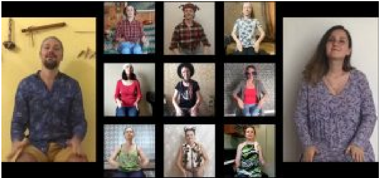
The Bremen Town Musicians body percussion composition

El año 2020 se ha convertido en el año de lo inesperado. La organización de la Escuela de verano en su forma tradicional, ha sido una tarea imposible. Aún así, muchos músicos estaban deseando poder participar en tal evento. Razón por la cual, la Asociación Interregional de Coros Infantiles y Juveniles de la Región Nor-occidental de la Federación Rusa decidió celebrar la Escuela de Verano para directores de orquesta y compositores en formato online. Una novedad que supuso un gran reto.