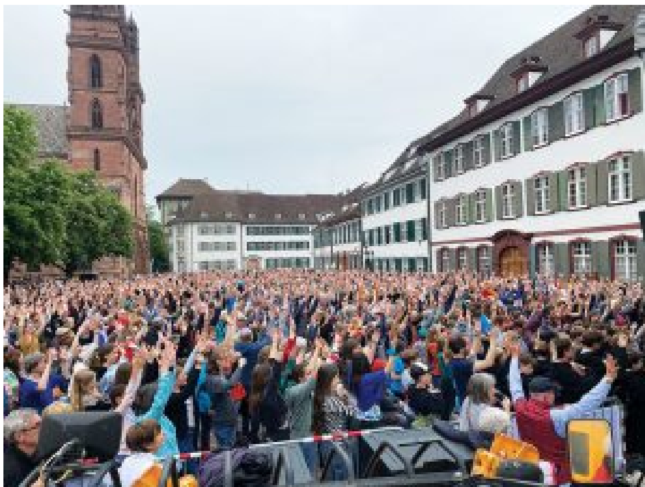
Body Percussion

La decimotercera edición del Festival Europeo de los Coros de Jóvenes de Basilea fue una experiencia inolvidable que dejó una marca indeleble en todos sus participantes. Más allá de las maravillosas interpretaciones y el crecimiento musical, el festival creó un espacio para el intercambio cultural, el crecimiento personal y conexiones que durarán toda la vida.