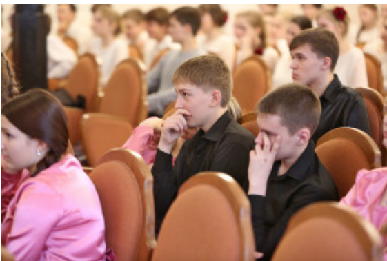
Choir 'Flamingo' from Nizhniy Tagil

empresas industriales y minas de oro. La fiebre del oro que golpeó los Urales a finales del siglo XVIII permitió a las familias más ricas, los Zotov, los Rastorguev y los Kharitonov, construir espléndidos complejos inmobiliarios que han sobrevivido hasta hoy. Junto a estos, se yerguen modernos edificios notables tanto por su tamaño como por su belleza. En el centro de la ciudad se encuentra el edificio más alto de todos los Urales, Siberia y Asia Central, el centro de negocios Vysotskii, de 198 metros de altura, con una plataforma de observación a 186 metros y un helipuerto en la azotea. Los ciudadanos y visitantes de la capital de los Urales ahora pueden tener la perspectiva de un ave para admirar esta hermosa ciudad.