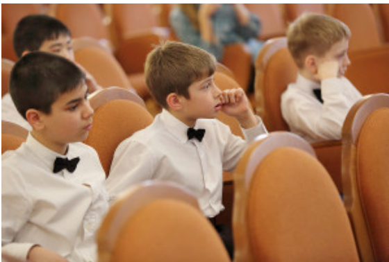
Choir 'Vdohnovenie' (Inspiration) from Kamensk-Ural'skiy

En lo concerniente a catedrales y lugares religiosos, la Iglesia de la Sangre de Todos los Santos que brilló en la Tierra Rusa, junto con la Corte del Patriarca, son el orgullo y alegría de nuestros ciudadanos. La iglesia es una de las más grandes no solo en Ekaterinburgo, sino en toda Rusia. La Iglesia de la Santísima Trinidad y la Iglesia de Alexander Nevsky, situada en las tierras del convento de Novotikhvinskii, también asombran a los visitantes con su tamaño y belleza. El lugar visitado con más frecuencia por los invitados de Ekaterinburgo es el Monasterio de los Reales Portadores de la Pasión en Ganina Yama, que ha obtenido una fama macabra fuera de Rusia como el lugar donde fueron traídos los restos del último emperador ruso y su familia para su descanso en 1918.