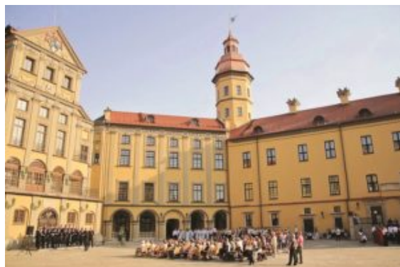
Concert in the castle courtyard

El concierto competitivo con repertorio profano tuvo lugar en el patio interior del magnífico castillo de Nesvizh, restaurado hace muy poco, a un centenar de kilómetros al sudoeste de Minsk. Ese sitio es famoso porque fue allí donde se imprimió el primer libro en la lengua bielorusa en 1562 .