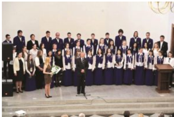
The final awards ceremony

Como colofón se repartieron los premios a los coros participantes y tuvo lugar un magnífico concierto de gala durante el cual se interpretaron las piezas estudiadas durante las masterclasses.