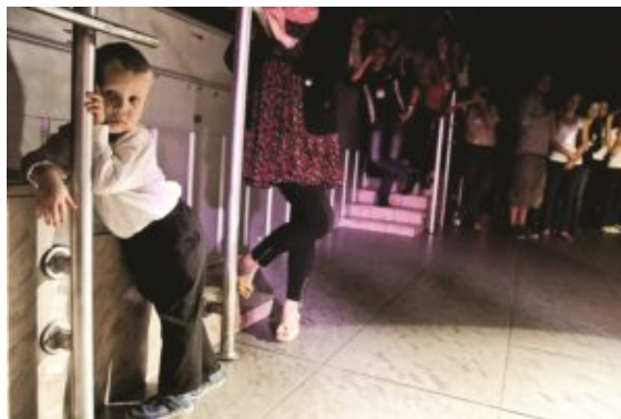
The youngest guest at the party?

Como colofón se repartieron los premios a los coros participantes y tuvo lugar un magnífico concierto de gala durante el cual se interpretaron las piezas estudiadas durante las masterclasses.