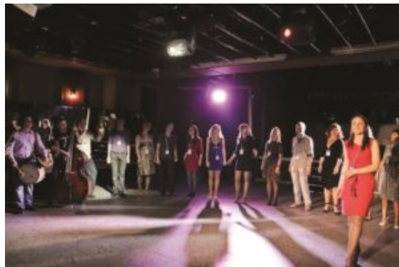
Evening concert at the disco

Naturalmente si pensáis participar en el Foro el año próximo i prepararos a la degustación obligatoria de vodka, del que los bielorusos están particularmente orgullosos! Casi en frente de mi hotel se hallaba la famosa destilería "Kristall". Y sus intensos efluvios son capaces de marearte i incluso a través de las rejillas del aire acondicionado! Bromas aparte, tuve que rechazar educadamente la tercera copita de vodka que me ofrecieron en la fiesta de clausura por motivos obvios. Y fue sorprendente sin embargo constatar cómo a mis alrededores los colegas rusos y bielorusos eran capaces de seguir perfectamente lúcidos aún después de multitud de brindis en honor de algo o alguien.