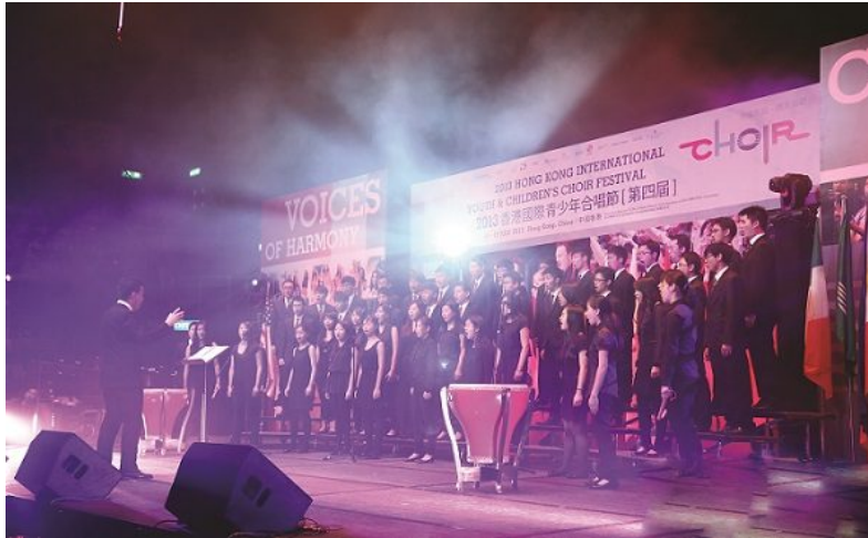
Diocesan Choral Society (Hong Kong, China) singing with accompany of the Chinese drum

Los coros, provenientes de China, Taipéi, Finlandia, Hungría, Indonesia, Macao, Malasia, Rusia y EE.UU., se reunieron en Hong Kong para unirse a esta fiesta coral internacional. La temática de la edición de este año giraba en torno al eslogan: «Voces de Armonía, coloreando el arcoíris». El arcoíris simboliza la esperanza; la idea de colorear al arcoíris representa el crecimiento de nuestra esperanza y el concepto de mantener nuestro sueño brillando en el escenario. Los diferentes colores del arcoíris promueven el espíritu de tolerancia y respeto mutuos entre las personas, sin importar su raza o nacionalidad. La música, como lenguaje común a lo largo y ancho del planeta, trae felicidad y armonía a todos y, al mismo tiempo, refleja la singularidad de cada individuo.