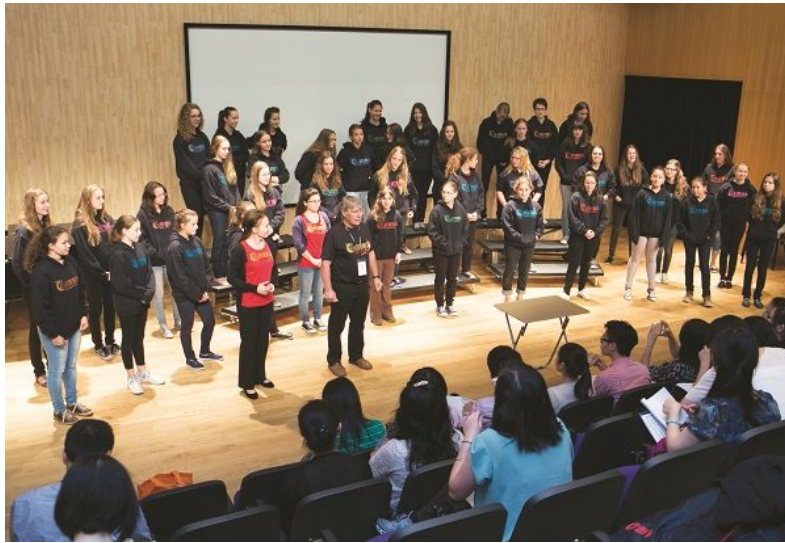
Conducting Master Course by Maestro Dénes Szabó from Cantemus Children's Choir