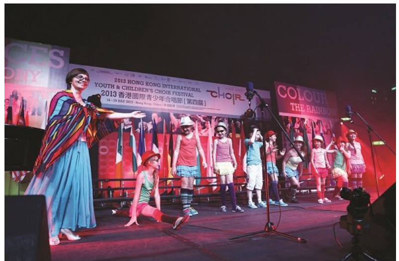
Rassvet (Russia) receives a warm applause for their energetic performance