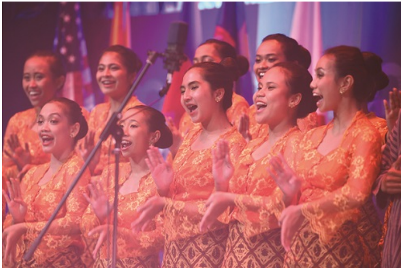
Voca Erudita Student Choirs of Sebelas Maret University (Indonesia) performing in Indonesian traditional costume

unos de otros. Al final de cada concierto amistoso, los miembros del jurado profesional hicieron comentarios sobre todos los coros participantes para ayudarles a mejorar. Además, los jueces principales de cada categoría compartieron sus comentarios y sugerencias con todos los coros participantes en la sesión «Conoce al Jurado». Como su propio nombre indica, en esta sesión, los directores y los miembros de los coros tuvieron la oportunidad de conocer a los 26 expertos del mundo coral que componían el jurado y hacerles preguntas o transmitirles sus preocupaciones relacionadas con los diferentes aspectos de la música coral.