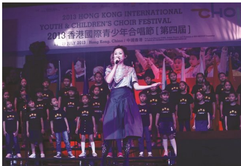
Miss Ivana Wong, a famous pop singer in Hong Kong, singing with the Hong Kong Treble Choir (Hong Kong, China)