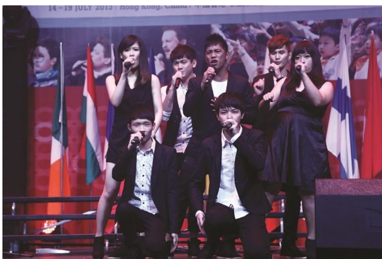
Resident Festival Choir: Just Vocal Band (Chinese, Taipei)

La edición de 2013 del festival ofreció un rico programa: además de las diez categorías de la competición y los doce conciertos, hubo una clase magistral de dirección y nueve talleres. Seis coros residentes, además del Cantemus Children's Choir, de Hungría; el Club For Five, de Finlandia; el Hong Kong Treble Choir, de China; el Just Vocal Band, de Taipéi; y el Shi-kai LI Lahu Family of Pu'er, de la provincia de Yunnan (China), ofrecieron maravillosas representaciones en el Emperor's Voices y en el ciclo de conciertos corales internacionales, haciendo que la audiencia experimentara un viaje coral internacional. Los doce conciertos tuvieron lugar en cuatro salas de conciertos de excelente acústica.