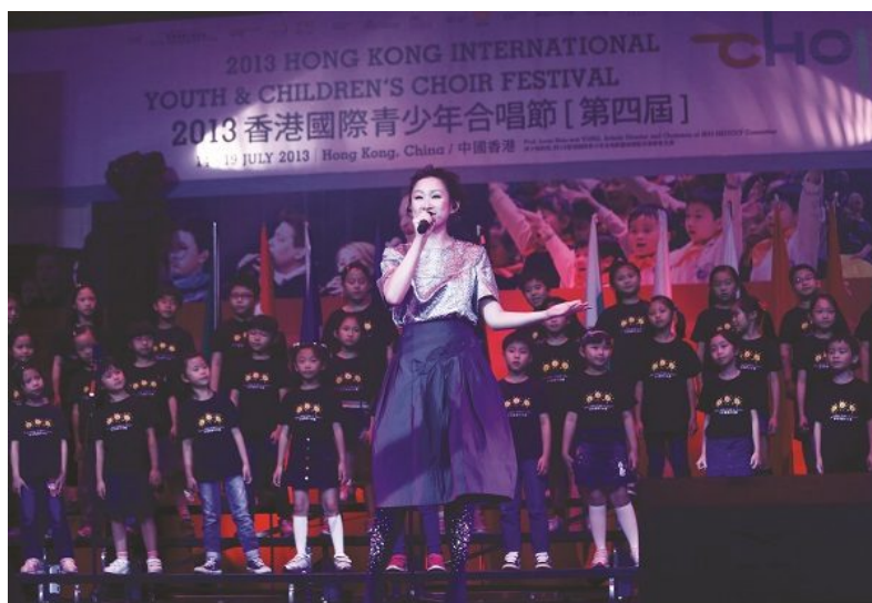
Miss Ivana Wong, a famous pop singer in Hong Kong, singing with the Hong Kong Treble Choir (Hong Kong, China)