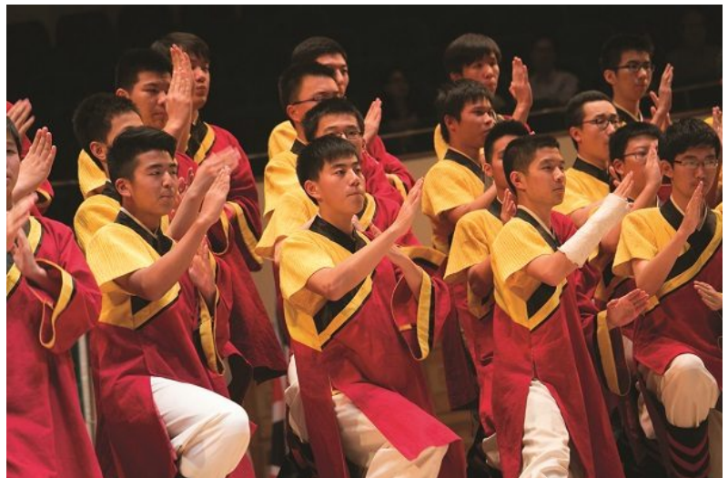
Youth Choir, TB voices (age 29 or under): Shanghai Yangjing High School Men’s Choir (China)