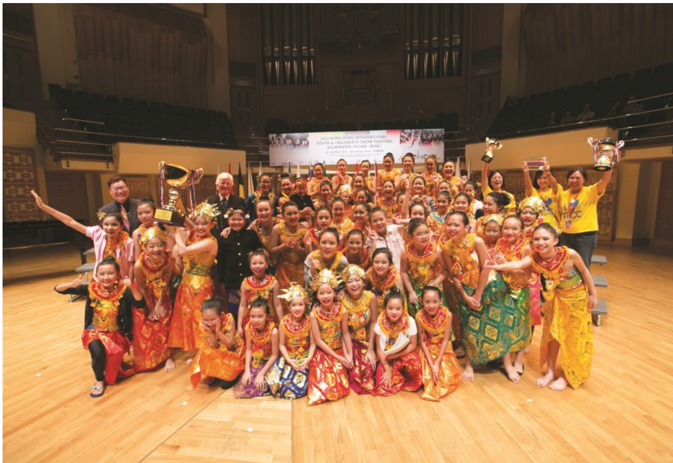
2013 HKIYCCF Choir of the World, Outstanding Conductor Award and Best Stage Effects, Champion of Choirs, SA voices (age 16 or under): The Resonanz Children Choir (Indonesia)