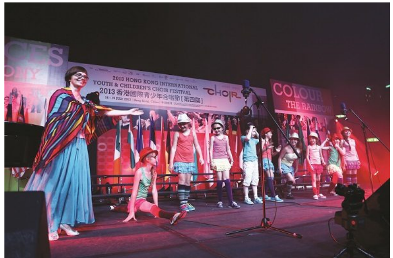
Rassvet (Russia) receives a warm applause for their energetic performance