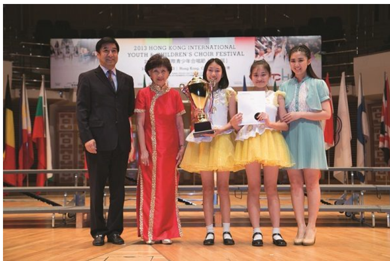
2013 HKIYCCF Jury's Prize: Binhai Primary School Choir – Sound of the Sea (China)