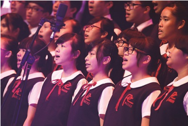
Pui Ching Middle School Choir (Macau, China) presents The Macau Song in the Opening Concert