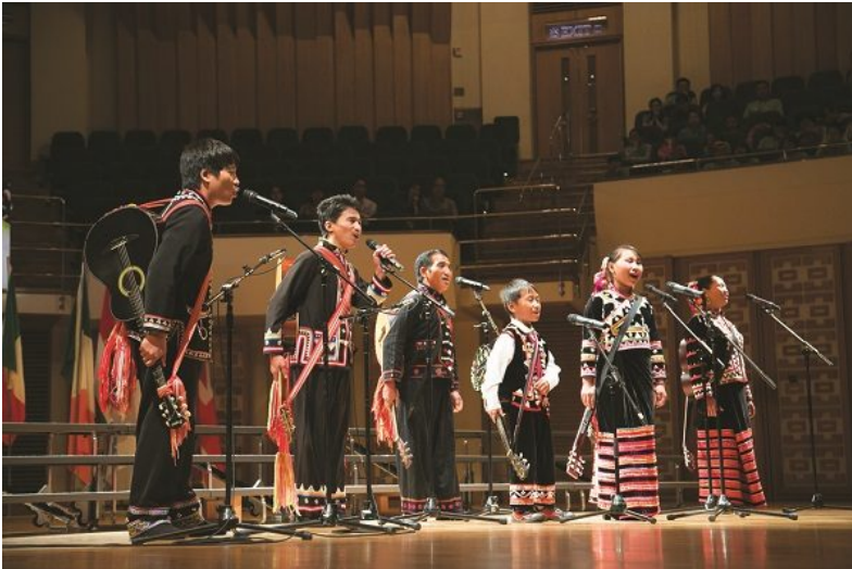
World-class Choirs Series II – Young People’s Chorus of New York City x Just Vocal Band x Shi-kai LI Lahu Family of Pu’er (China)