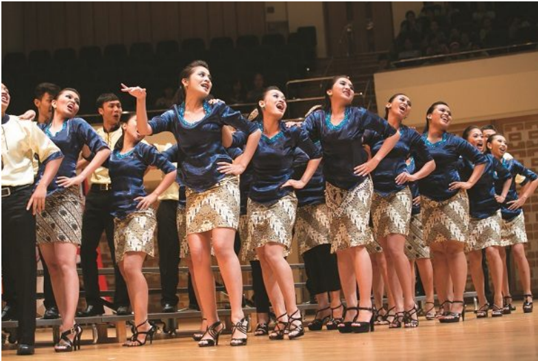
Youth Choir, SATB voices (age 29 or under): Voca Erudita Student Choir of the Sebelas Maret University (Indonesia)