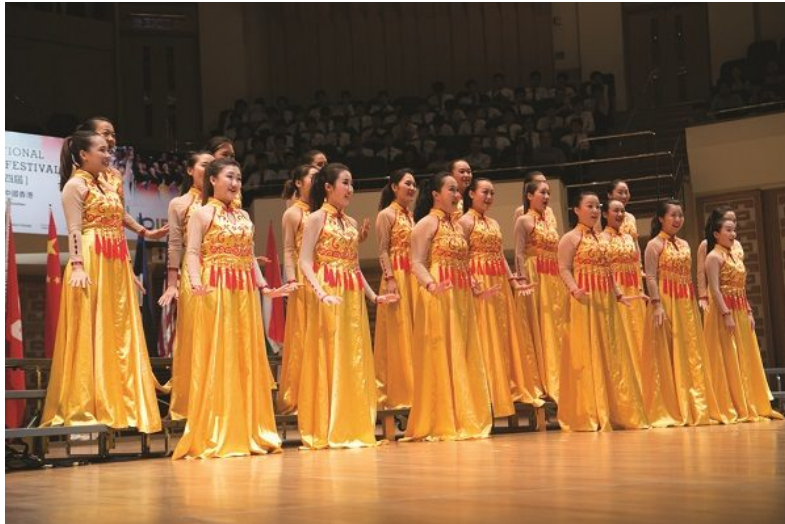
Youth Choir's, SA Voices (age 29 or under): Candlelight Chorus of Shanxi Normal University (China)