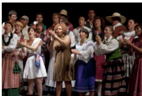
World Youth Choir 2009

Cantar en grupo es una actividad básica que pone en práctica la tolerancia, simpatía, y conciencia de los demás hacia una meta común de lograr la comunicación entre las personas y envolverlas en una experiencia de belleza compartida. Este acercamiento es una característica que todo corista comparte con sus compañeros, además de ser la raíz del coro. Esta forma de pensar necesita ser comunicada y celebrada por todo el mundo, con la esperanza de que el mundo entero tenga conciencia de que tal característica no sólo es un elemento de un ideal, sino que está presente en la sociedad.