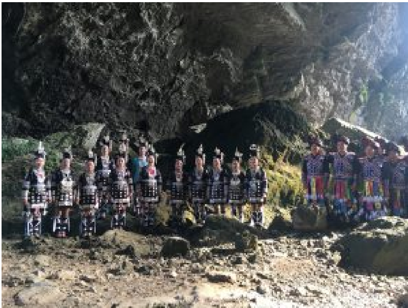
Dong Singers (picture taken in 2016)

La plupart des constructions des Dongs seraient construites en suivant les principes d'un ancien système philosophique appelé Feng Shui , c'est-à-dire Vent-Eau en français. Le pouvoir du Feng Shui harmonise et équilibre tous les éléments de l'environnement local qui entoure la structure. C'est une métaphysique chinoise importante. Les ponts vent-pluie sont construits pour répondre à tous les critères, y compris le choix de leur emplacement, pour développer le pouvoir du Feng Shui et protéger la bonne fortune du village.