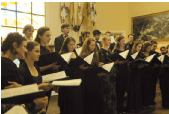
Chamber Choir Festino. Rehearsal before the final concert

L'inclusion dans le programme d'un cours sur la musique chorale moderne de l'Europe de l'Ouest a contribué de façon importante à l'expansion du répertoire de concert de la jeunesse russe. Pendant le cours de maître, les participants ont la possibilité de découvrir de nouveaux noms et de nouvelles pièces dignes d'intérêt qui leur permettront de continuer à s'intégrer avec de plus en plus de succès dans le milieu de la musique chorale en Europe de l'Ouest.