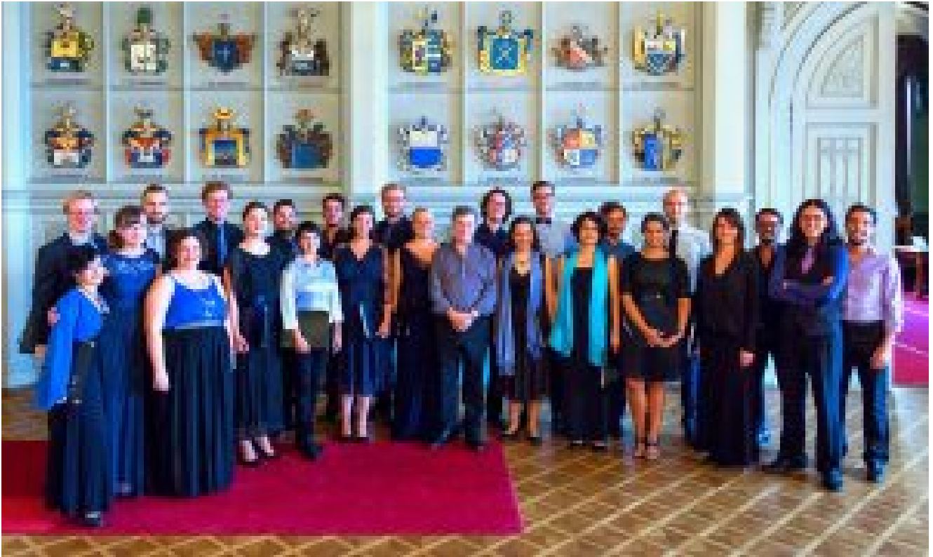
Tenso Chamber Choir pictures © Leo Samama

Jeune musicienne, j'ai eu la chance d'intégrer des classes de chant choral et solfège/entraînement à l'oreille musicale parallèlement à mes études instrumentales depuis l'âge de onze ans à l'institut Grégorien de Lisbonne. Je suis consciente que, sur le plan international, tous les systèmes éducatifs n'incluent pas la musique dans leur parcours standard, mais je crois profondément que débiter jeune dans un chœur d'enfants ou de jeunes non seulement peut faire naître des vocations pour une future carrière dans ce domaine, mais surtout procure une formation qui sera essentielle pour l'avenir. Si ce n'est que plus tard que vous êtes devenus passionnés par le chant choral, ne vous inquiétez pas : vous gardez toutes vos chances! L'une des premières choses à faire est de commencer par la musique elle-même: quels types de sons et de structures vous donnent envie d'en écouter davantage, par quelle partie de l'histoire de la musique êtes-vous attiré, quel type et quelle taille de chœur appréciez-vous le plus quand vous assistez à un concert ou que vous écoutez un enregistrement ?