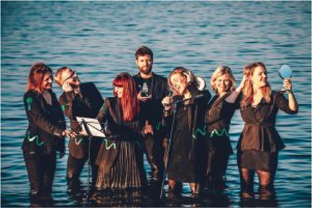
Dopplers NORD