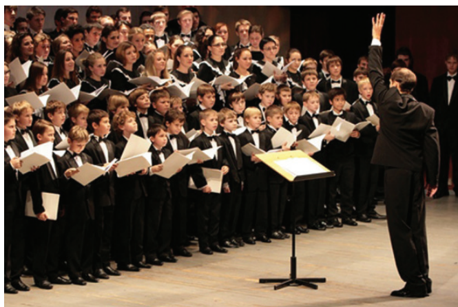
Mixed choir of Choir Art Academy

d'hommes, mixtes, se composant de plus de deux cents chanteurs) se sont présentés en tant que groupes exceptionnels de concert, exécutant des programmes solos exigeants et participant à des interprétations de grande échelle, des compositions vocales-symphoniques accompagnées par des orchestres russes et étrangers de premier plan.