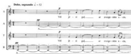
Figure 3. Vasks, Māte Saule, m. 36-40.

(Click on the image to download the full score)