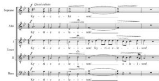
Figure 5, Uģis Prauliņš, "Kyrie" de la Missa Rigensis, m.1-6.

(Click on the image to download the full score)