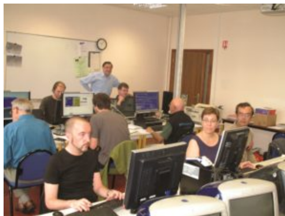
A Musica Session at the University of Strasbourg, with participants from France, Germany, Switzerland