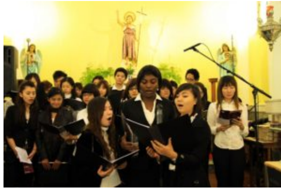
University of St. Joseph Choir

Une des idées que j'avais depuis le tout début était de créer la possibilité, pour ceux qui veulent développer leurs savoirs dans la direction chorale,, de leur donner non seulement l'entraînement nécessaire mais aussi une qualification académique. C'est pourquoi j'ai suggéré au recteur de l'université de créer un Master en Direction chorale. Le recteur étant par chance un grand Amateur de musique et il accepta tout de suite cette proposition. J'ai commencé sans attendre à travailler sur un curriculum pour le soumettre à l'approbation des autorités concernées dans le programme d'éducation de Macao. Après avoir eu l'autorisation, nous nous sommes mis au développement de ce nouveau programme, unique à Macao et même à ma connaissance unique dans cette aire géographique. J'ai dès le début prévu de proposer ce Master en trois phases annuelles intensives plutôt que sur toute une année. Pourquoi ? Pour donner aux personnes qui n'habitent pas à Macao l'opportunité de venir et de suivre le Master pendant leurs vacances, sans quitter leur travail. Les modules sont proposés durant trois semaines en juin, ce qui implique que les personnes qui s'inscrivent pour le Master maintenant viendront à Macao en juin 2011, juin 2012 et juin 2013.