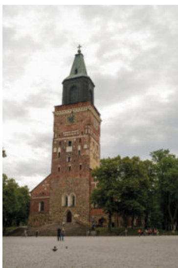
The old Cathedral downtown Turku

Les ateliers seront dispensés en anglais.