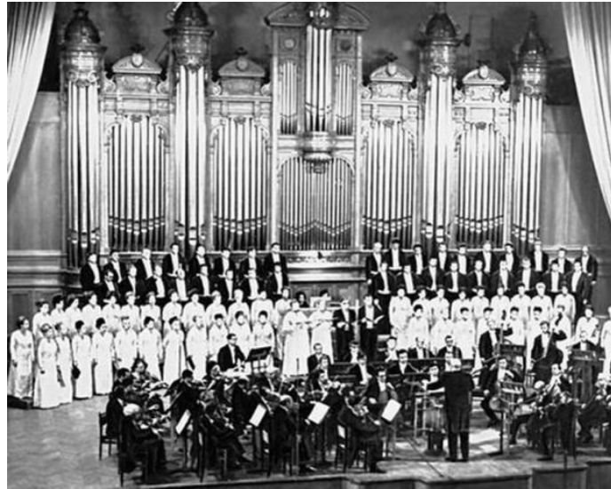
Concert of the State Academic Russian Choir of the USSR

La plupart des autorités soviétiques ont jugé très important de créer le “ chœur parfait ” (celui qui serait une référence pour les groupes amateurs et professionnels du pays). Curieusement, le choix n’a pas été porté sur un chœur d’une grande organisation déjà existante, mais sur le cercle musical de la Radio de l’Union. Dans un premier temps, la mission du groupe fut de propager la musique soviétique, alors activement diffusée dans des genres variés: des cantates et oratorios aux chants et aux chorales-modèles. Cependant, afin d’acquérir une dimension supplémentaire, une place importante dans le répertoire du chœur était laissée aux œuvres chorales classiques russes et étrangères, rendant le groupe quasiment universel.