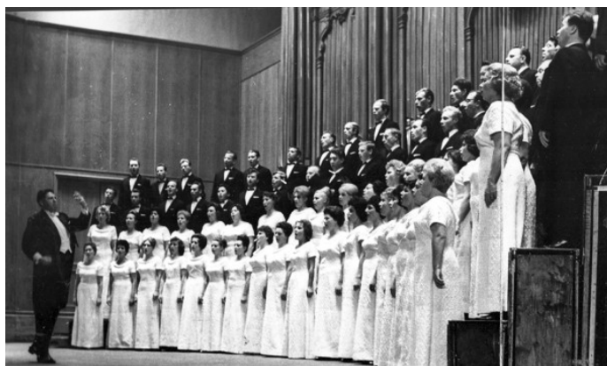
Capella Choir concert under the baton of Alexander Yurlov

Lorsque l'on évoque le chant choral professionnel de la période soviétique, nous ne devons pas oublier le Chœur Républicain Académique Russe , à un moment considéré comme un concurrent direct du Chœur National , en dépit du fait qu'il était soumis aux autorités républicaines et non à l'Union.