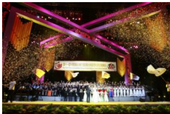
The opening ceremony

D'abord intimidé par l'importance de l'événement, le poids de