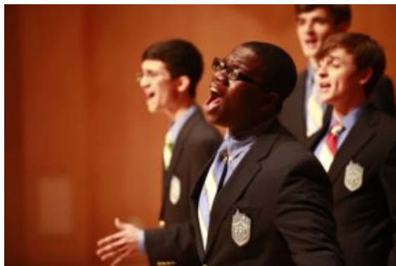
The Youth People Chorus from New York City

Nous étions réellement contents à l'idée de rencontrer des chœurs exceptionnels et de voir de nos propres yeux les merveilles historiques de la Chine. Une fois arrivés, nous avons été étonnés d'apprendre que plus de 10.000 participants s'étaient mobilisés pour mettre en place le programme du 11 e Festival International annuel de Chant Choral de Chine, alors que c'était la première année que la FIMC s'impliquait en Chine.