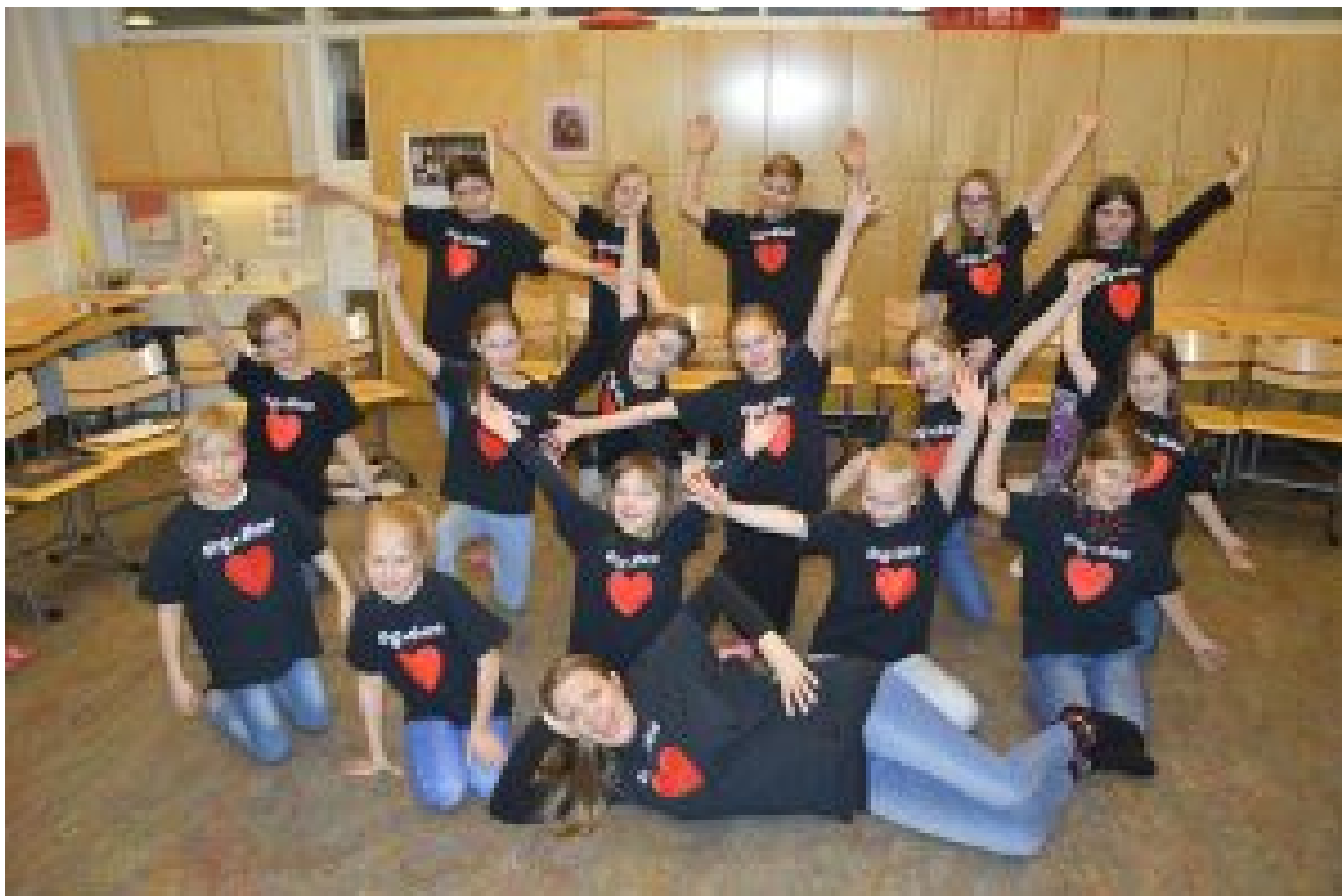
Rehearsals, March 2019, Westendinpuison school, Espoo, Finland

n'écotent pas. Faisons entendre les belles voix des enfants et faisons briller les âmes dans nos chorales. C'est important !