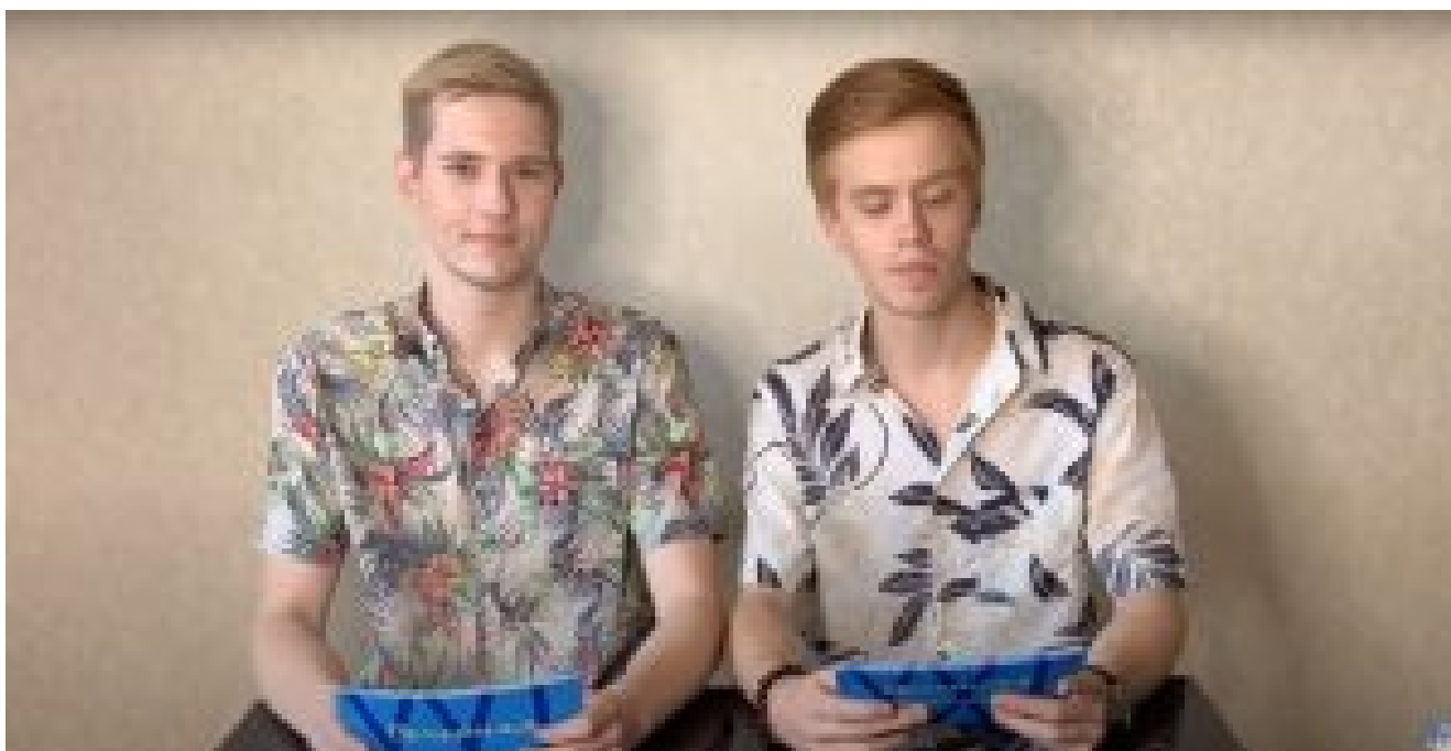
Evening online concerts