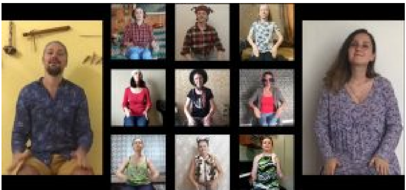
The Bremen Town Musicians body percussion composition

Chaque année, à la fin du mois de juin, des chefs et des compositeurs de toute la Russie et des pays voisins se rendent à Gatchina, une petite ville près de Saint-Petersbourg. Pendant 6 jours, Gatchina se transforme en centre de musique chorale, en organisant des séminaires avec les chefs de chœur russes les plus connus, des master classes avec des experts musicaux européens, des cours de composition de musique chorale et des concerts des groupes participants ainsi qu'un échange d'expériences et d'inspiration en matière de création musicale.