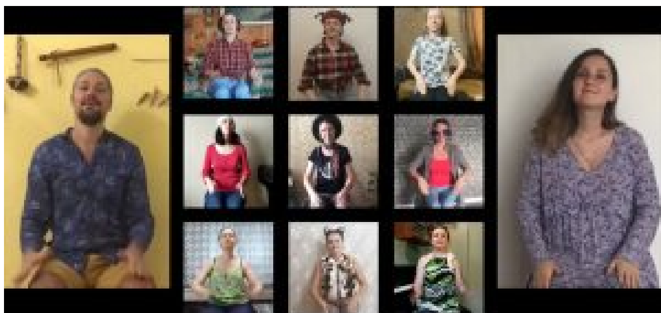
The Bremen Town Musicians body percussion composition

Chaque année, à la fin du mois de juin, des chefs et des compositeurs de toute la Russie et des pays voisins se rendent à Gatchina, une petite ville près de Saint-Petersbourg. Pendant 6 jours, Gatchina se transforme en centre de musique chorale, en organisant des séminaires avec les chefs de chœur russes les plus connus, des master classes avec des experts musicaux européens, des cours de composition de musique chorale et des concerts des groupes participants ainsi qu'un échange d'expériences et d'inspiration en matière de création musicale.