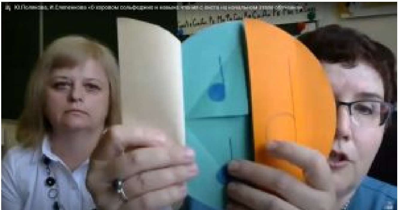
Visual aids for children

Malgré toutes les restrictions, l'Université d'été pour chefs et compositeurs 2020 a été un succès, et a reçu de nombreuses critiques reconnaissantes et positives.