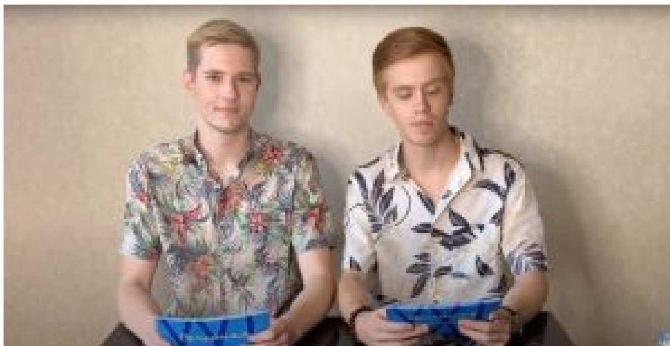
Evening online concerts