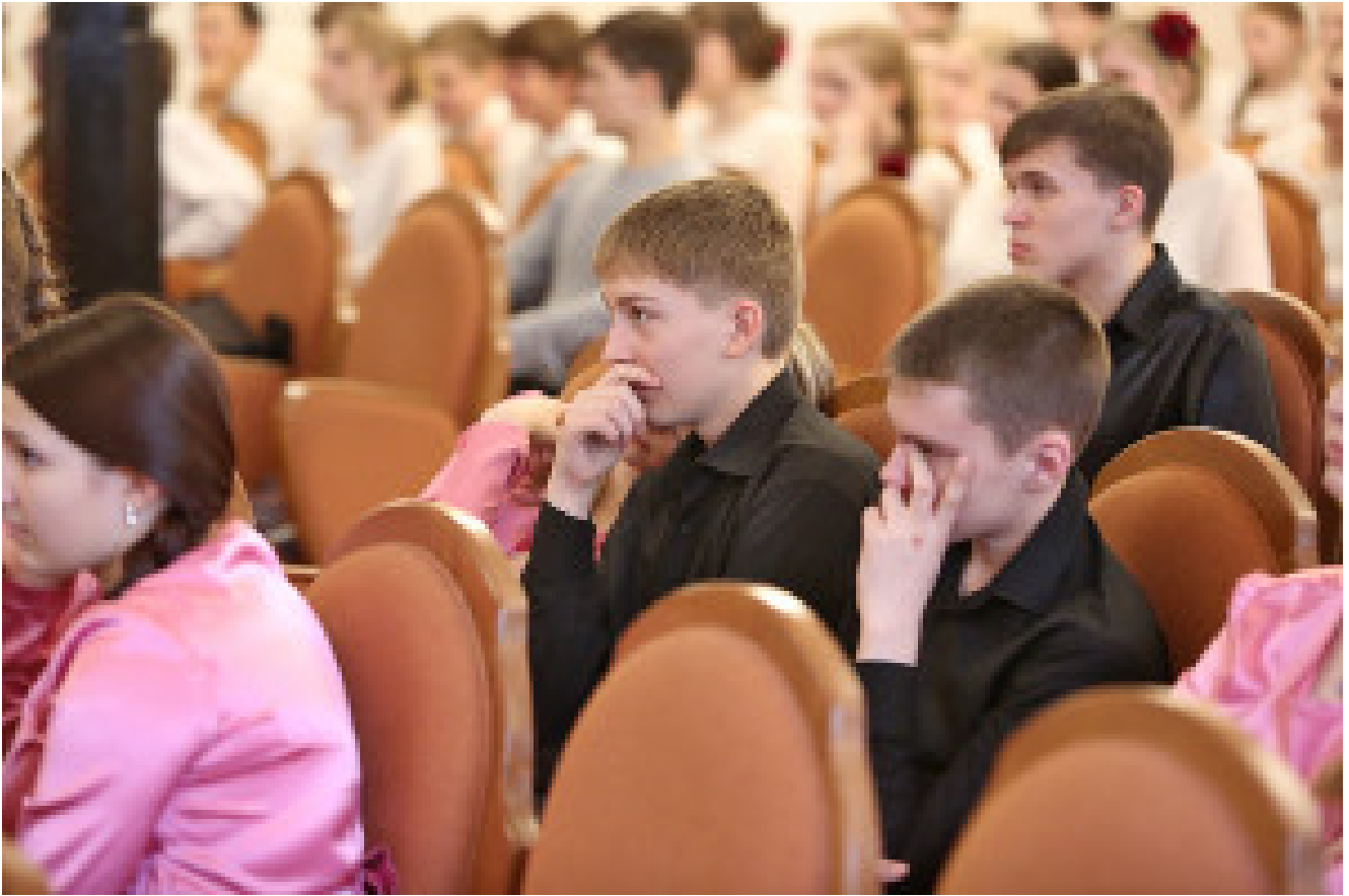
Choir 'Flamingo' from Nizhniy Tagil

Ekaterinbourg est un des grands centres de théâtres parmi ceux de la Russie. La ville a 24 théâtres, la plupart d'entre eux sont connus non seulement en Russie mais à l'étranger aussi. Les nombreux prix emportés par nos théâtres au Festival Golden Mask (Festival de masque d'or) le concours théâtral principal en Russie témoignent de l'originalité de leurs performances. Le théâtre communal de marionnettes accueille un des plus prestigieux shows de marionnettes au monde le "Petrouschka le Grand". Le Festival International de cirque est organisé à Ekaterinbourg depuis de nombreuses années et est unique dans l'histoire des cirques du monde.