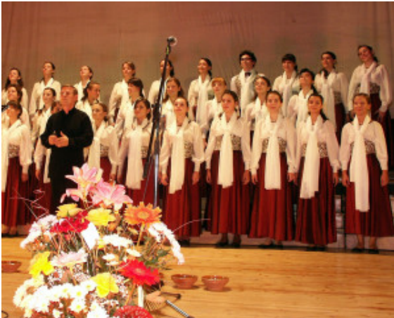
Le Choeur d'Enfants de la Radio et TV roumaines

l'association, qui devint une des principales structures culturelles de la ville.