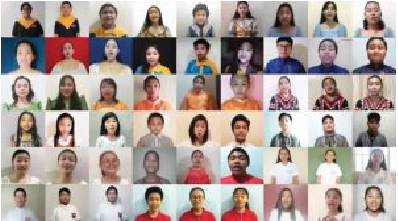
Young Voices of the World participants: 1st row (from left to right) Savior Singers, Mandaue Children's Choir, Aurorae Girls Choir; 2nd row (from left to right) St. John the Baptist Children's Choir, Bitik Children's Choir, Kilyawan Boys Choir; 3rd row (from left to right) Voices of the South Children's Choir, Calasiao Children's Choir, Dreamweavers Children's Choir; 4th row (from left to right) Raz Singing Cherubim, Living Learning Children's Chorus, Himig Zamor; 5th row (from left to right) Loboc Children's Choir, Dagupan City Children's Choir, Baao Children and Youth Choir; 6th row (from left to right) Las Pinas Boys Choir, Prayer Bible Fellowship Children's Choir, Laoag City Children's Choir