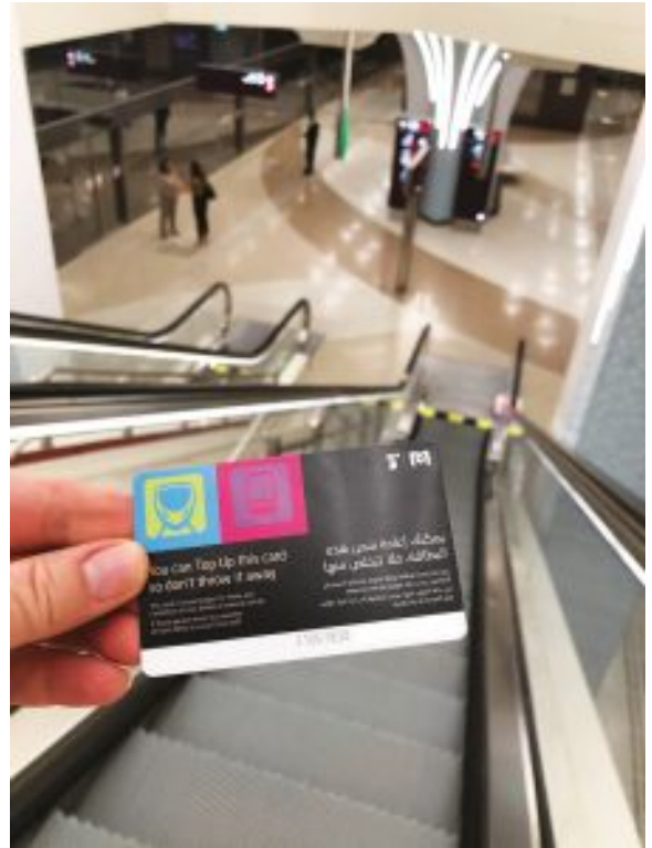
Doha Metro Card

empleen el proceso de desalinización de ósmosis inversa, más eficiente en el plano energético.[7]