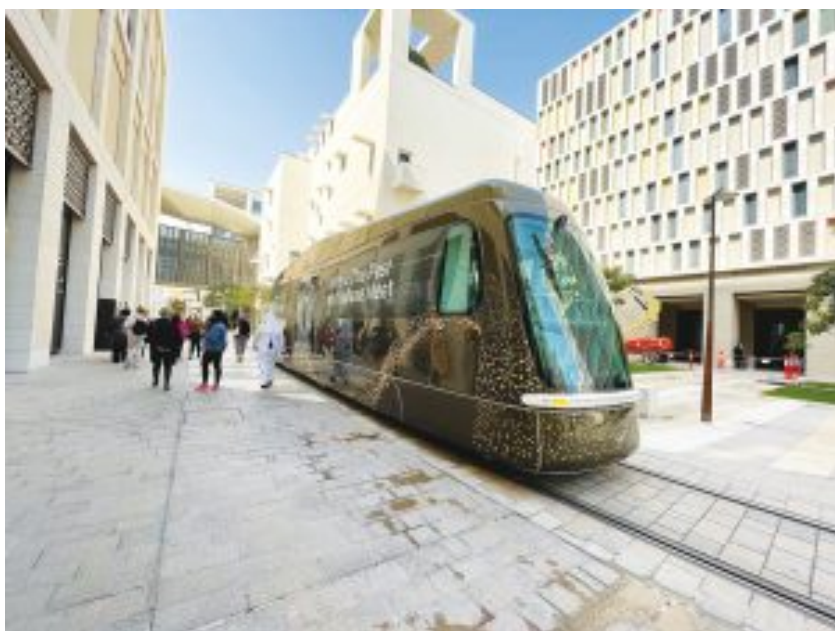
Msheireb tram

Dado que todos buscamos alternativas para cambiar el mundo a mejor, Catar espera seguir siendo un motor de cambio al aliarse recientemente con EEUU, Noruega, Arabia Saudí y Canadá para crear el Net Zero Producers Forum para cooperar con el fin de desarrollar estrategias prácticas de cero emisiones de carbono.[9]