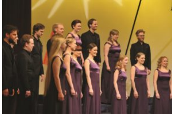
Sofia Vokalensemble, the winner of the European Grand Prix

con satisfacción la victoria del Sofia Vokalensemble dirigido por Bengt Ollén.